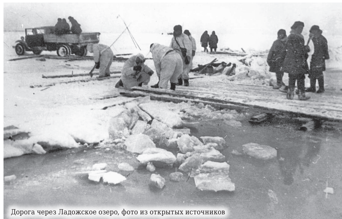
Дорога через Ладожское озеро