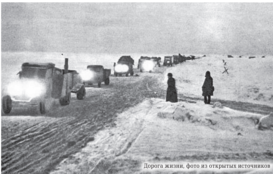
Дорога жизни

Сели в машину, командир полка мне и говорит: «Руководить строительством этой дороги я поручаю Вам». Я ответил, что «хорошо». По приезду в оперативную группу я сразу же занялся разработкой проекта организации работ. За каждым участком будущей дороги я закрепил инженера из своего отдела, который полностью отвечал за строительство своего участка дороги. Для этого ему выделялись люди и инструмент. Помню я этот день в начале октября 1941 года: погода была пасмурная и прохладная, шёл моросящий дождь. Ночью к нам стали прибывать люди, почти одни женщины. Устроить их где-то в помещении не представлялось возможным, и вот они — голодные, усталые, почти без сна, в промокшей одежде и плохой обуви — рано утром приступили к строительству дороги. На болоте строили гать, лесоматериал — подтоварник и жерди — носили по тонкому болоту, на расстояние 700–800 метров. Иногда они, усталые, тащили одну жердь вдвоём, покачиваясь из стороны в сторону. Жаль было на них смотреть, а что делать? Война. Дорога очень была нужна, задание командира надо было выполнять, рядом шли бои. Трое суток, безропотно, самоотверженно, отдавая все свои силы, работали