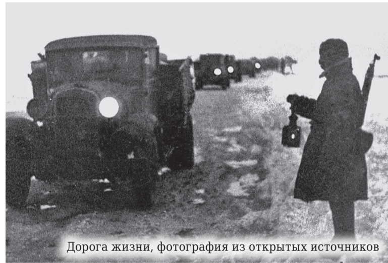
Дорога жизни

В моём распоряжении было две роты солдат и несколько команд, прикомандированных из других частей. Всего было личного состава 500 человек.