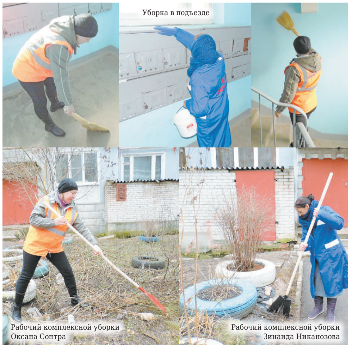
Уборка в подъезде