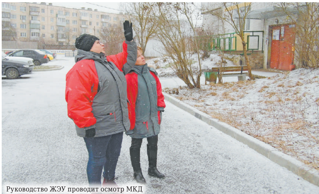
Руководство ЖЭУ проводит осмотр МКД