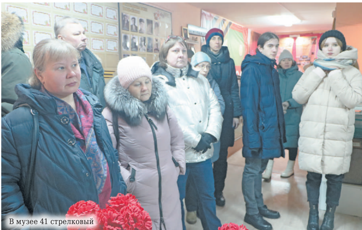
В музее 41 стрелковый