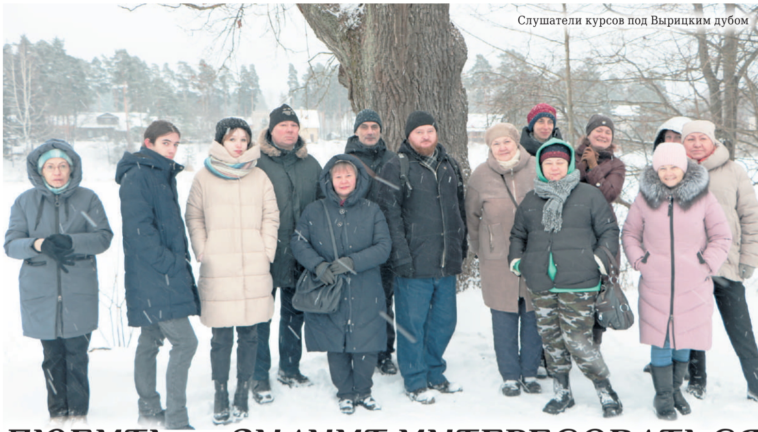
Слушатели курсов под Вырицким дубом