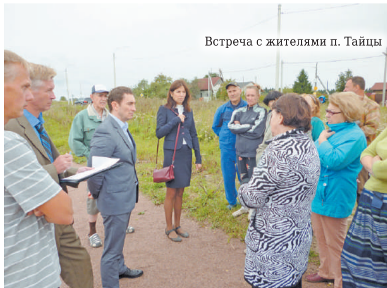
Встреча с жителями п. Тайцы

Призывы Жириновского «Каждой бабе - по мужику!» и «Каждому мужику - по бутылке водки!» были понятны и созвучны чаяниям «глубинного народа», а обещание омыть сапоги русского солдата в Индийском океане повышало у народа чувство «глубинного патриотизма». Естественно, что Владимир Вольфович пользовался популярностью и у средств массовой информации любого уровня. Не остался в стороне и выритчкий «Викинг», сделавший в 1997 году небольшое интервью с эпатажным партийцем на одном из мероприятий в Петербурге. Возможно, история на этом бы и