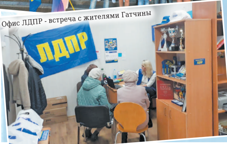
Офис ЛДПР - встреча с жителями Гатчины