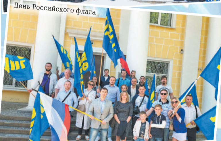
День Российского флага