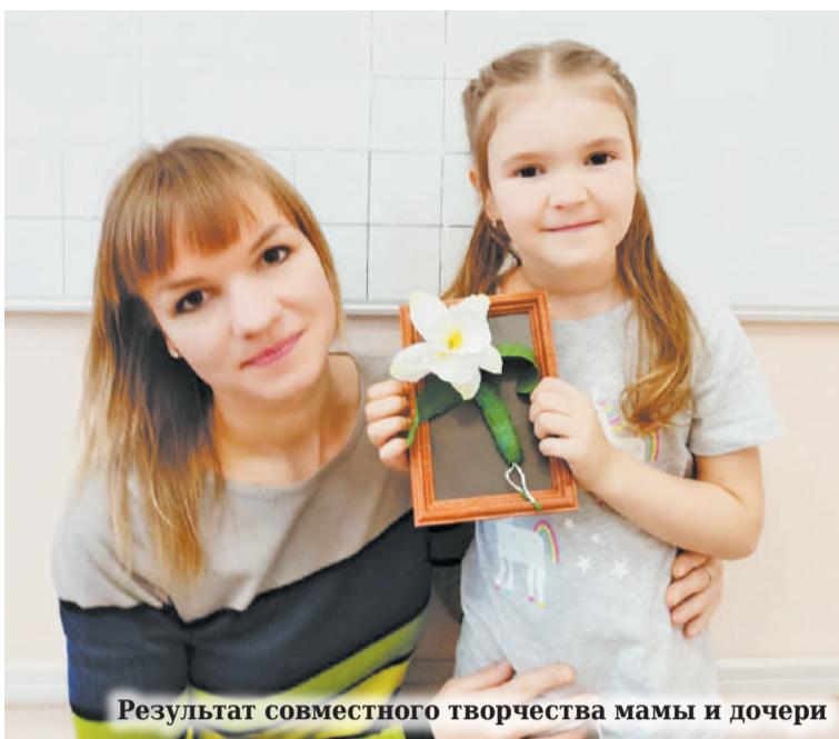
Результат совместного творчества мамы и дочери

3. Игротека: Совместные игры с детьми (настольные), подвижные, походы на природу, в музей, в библиотеку. Организация совместных дней рождения. Помещение и оборудование для этого есть. Просмотр кино-