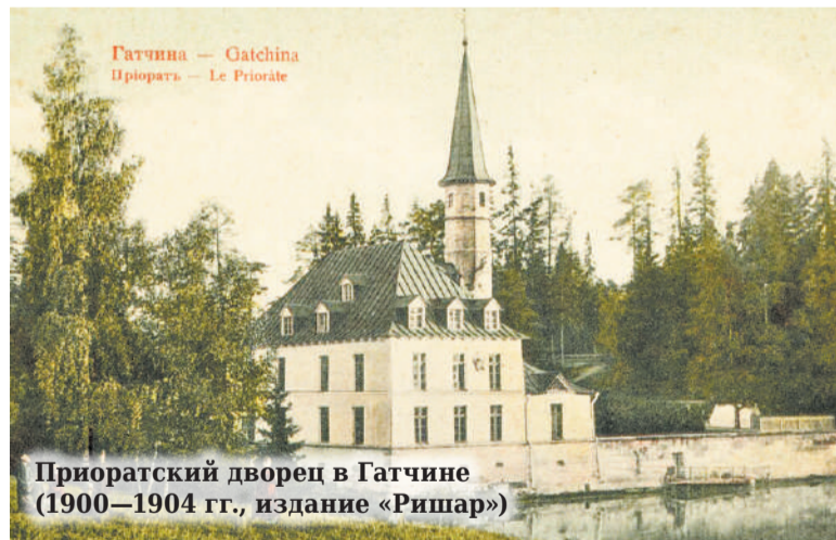
Гатчина — Gatchina