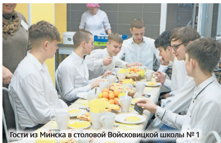
Гости из Минска в столовой Войковицкой школы № 1