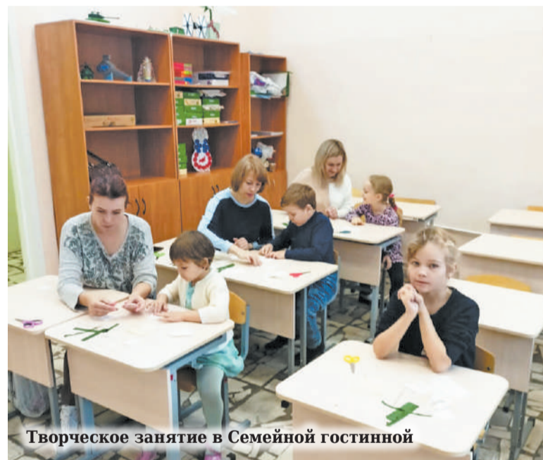
Творческое занятие в Семейной гостиной