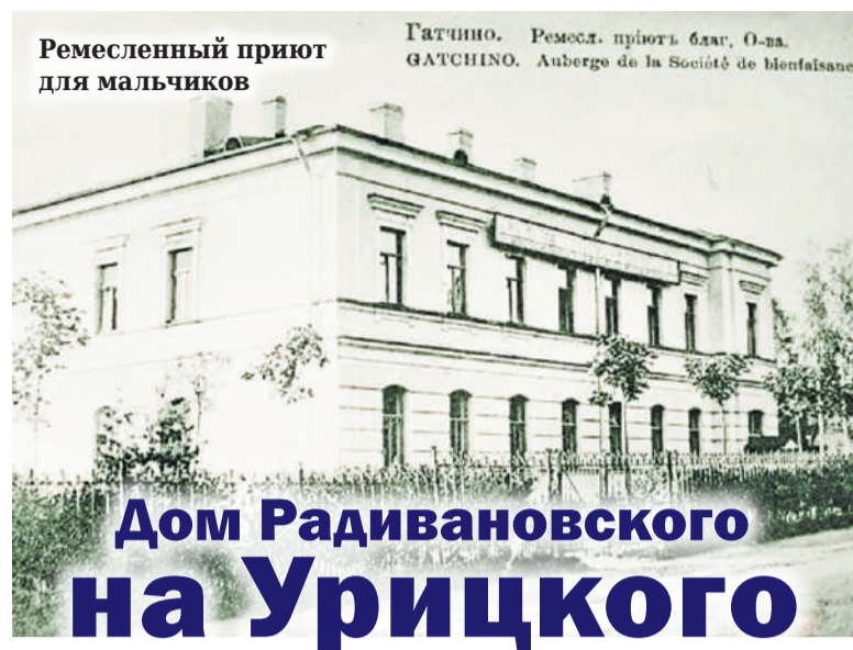
Ремесленный приют для мальчиков

Матвей ТЯГУНОВ Информация и фотографии из открытых источников