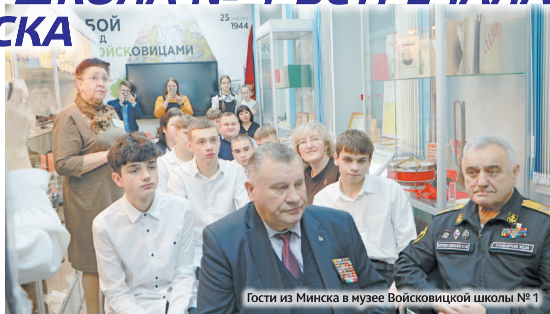
Гости из Минска в музее Войковицкой школы № 1

ным с именем Зиновия Колобанова. После войковицкой школы они отправились на место знаменитого танкового боя. А 20 декабря их ждали в гимназии № 209 Петербурга, которая славится военно-патриотической работой, и где несколько лет назад имя Зиновия Колобанова внесли в «Золотую книгу» Санкт-Петербурга. Затем делегация побывала во Всеволожске в музее «Битва за Ленинград» имени Зиновия Колобанова, где представлены подлинные образцы танковой и артиллерийской техники времён Великой Отечественной