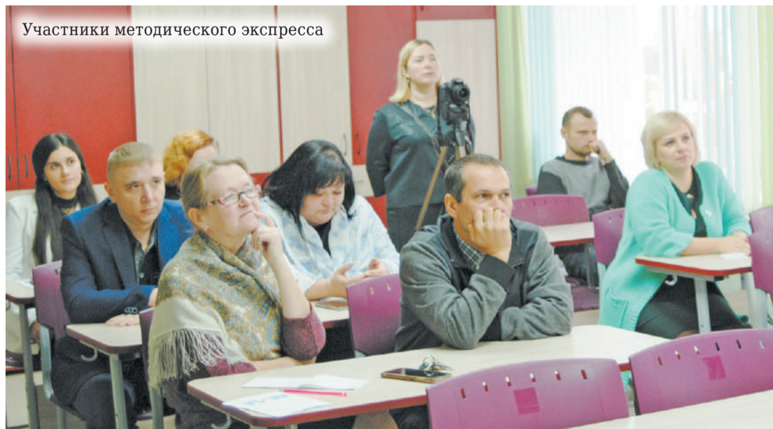
Участники методического экспресса