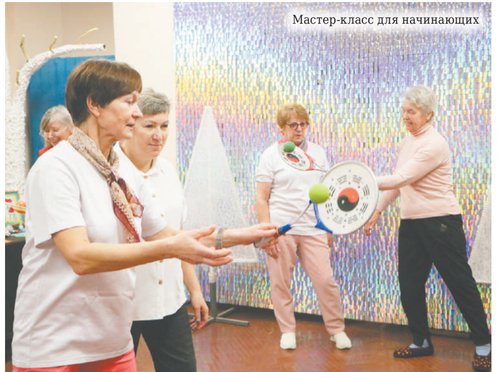
Мастер-класс для начинающих

и какой-то элемент упражнения изменила. «Ой! А мы это делали по-другому!» Конечно, по-другому, но нужно чтобы мозг не засыпал, нужно чтобы он постоянно работал, отработывал что-то новое. Я очень хочу, чтобы те, с кем я занимаюсь, никогда не встретились с деменцией, а если и встретились, то на