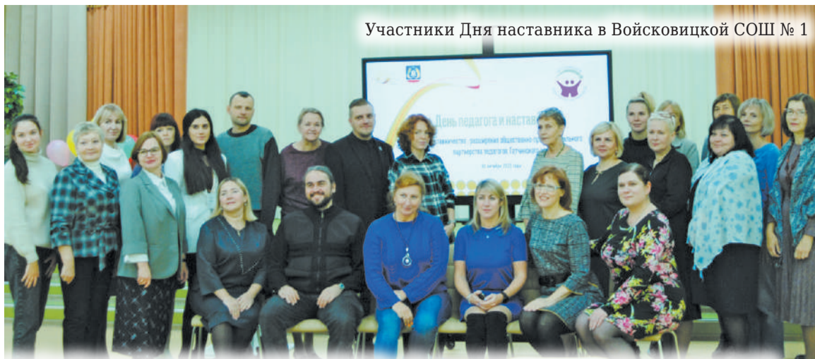
Участники Дня наставника в Войсовицкой СОШ № 1

Мы уже третий год работаем, и одна из задач, которую мы перед собой ставим — расширить наше пространство, мы даём возможность присоединиться к нашей организации и педагогам дошкольного образования и средне специального. В дальнейшем