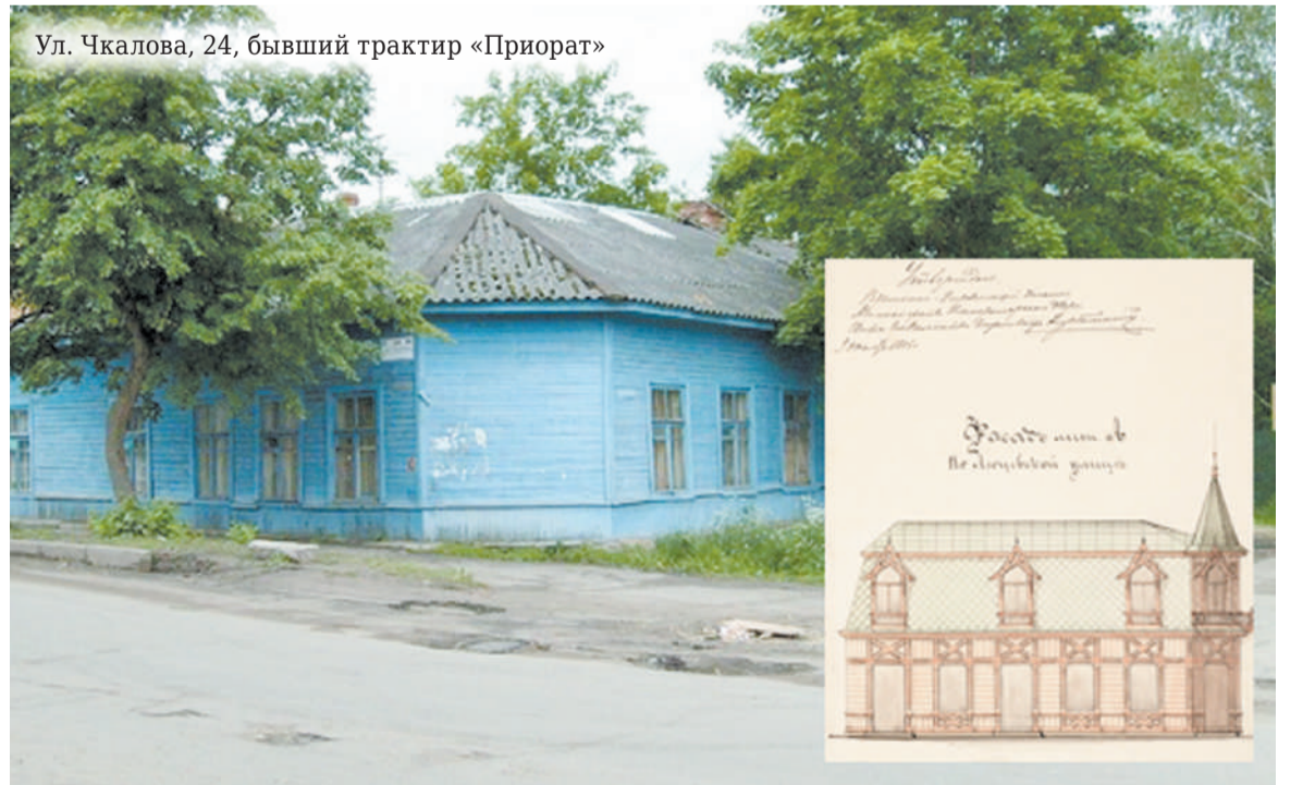
Ул. Чкалова, 24, бывший трактир «Приорат»