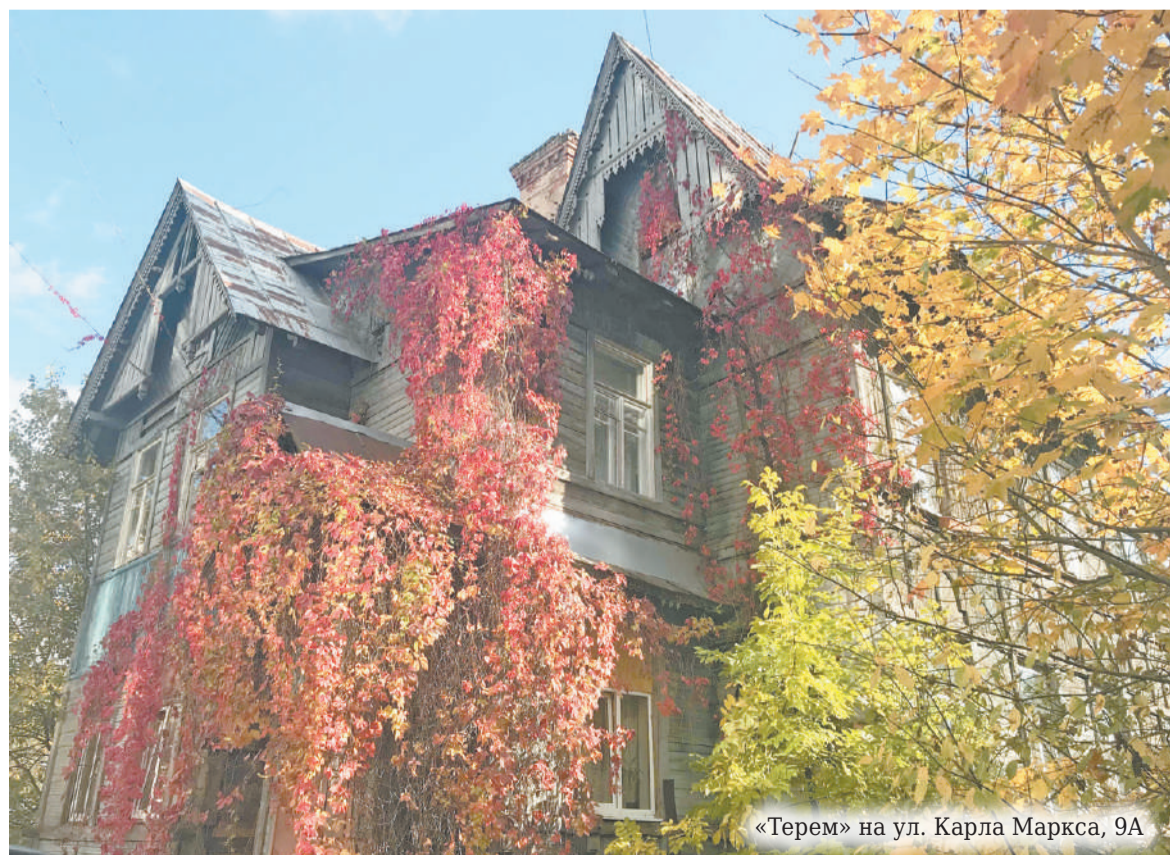
«Терем» на ул. Карла Маркса, 9А

И это логично. Ну какой частный бизнес будет вкладываться в предприятие, условия которого не прописаны, а обязанности