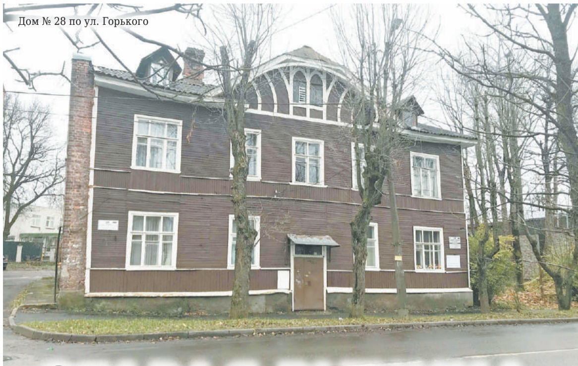
Дом № 28 по ул. Горького