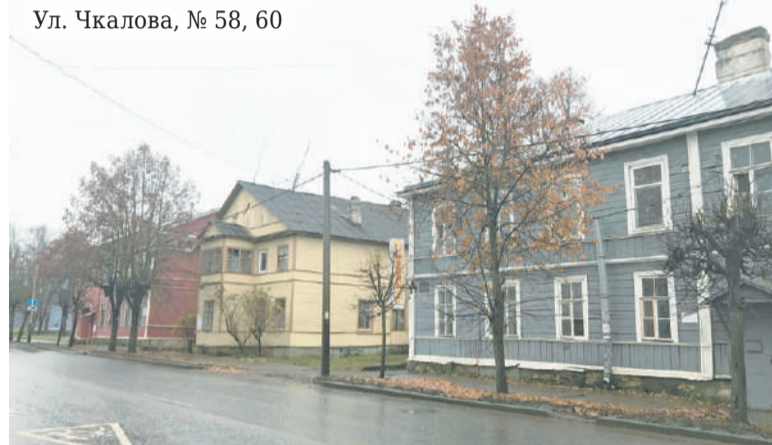
Ул. Чкалова, № 58, 60

зоне «ценной градоформирующей застройки» (официальное наименование этих зданий)?