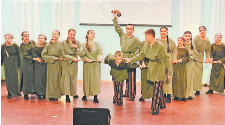
«О купце, о мужике и о мужицком пятаке»