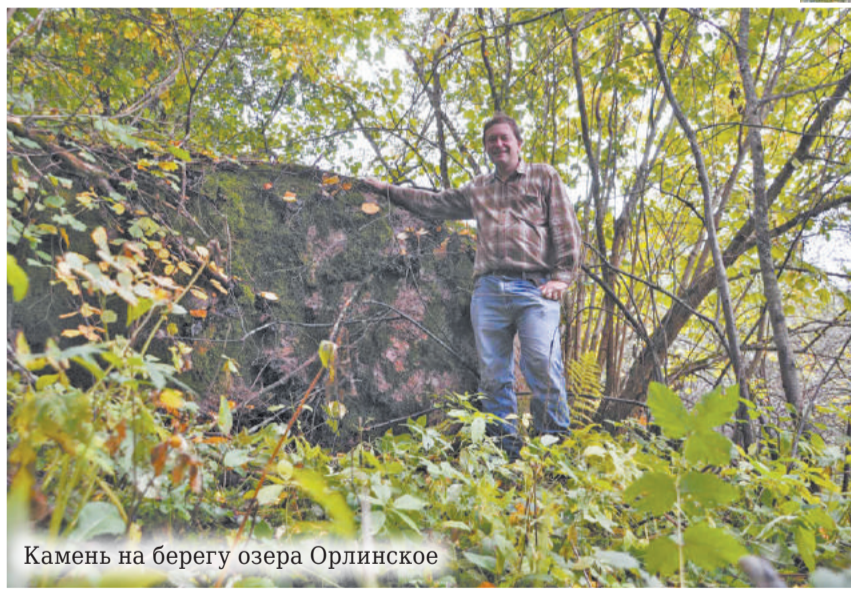
Камень на берегу озера Орлинское

Уездные ВЕСТИ – ОБЩЕСТВЕННО-ПОЛИТИЧЕСКАЯ ГАЗЕТА ГАТЧИНСКОГО МУНИЦИПАЛЬНОГО РАЙОНА ЛЕНИНГРАДСКОЙ ОБЛАСТИ