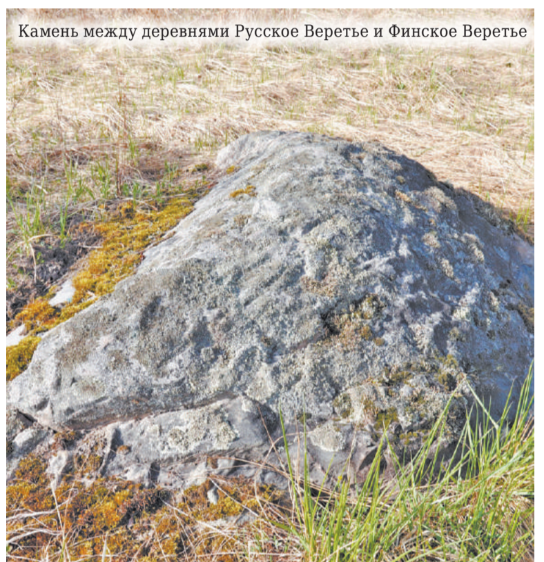
Камень между деревнями Русское Веретье и Финское Веретье