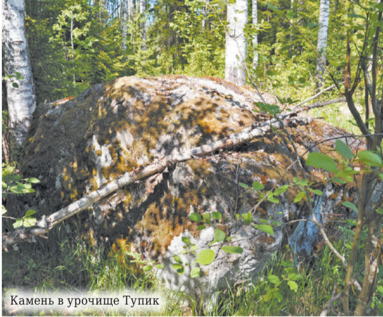
Камень в урочище Тупик

что это место было обитаемо очень давно. Пройти к камню из Вырицы можно по дороге, уходящей в лес и являющейся продолжением пр. Володарского. После того, как дорога пересечёт вторую ЛЭП 110кВ, начнётся луг, посреди которого и лежит камень.