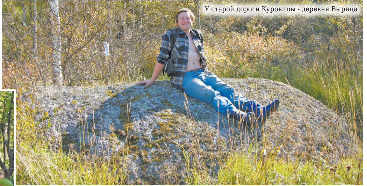
У старой дороги Куровицы - деревня Вырица

камнями. Этот камень в протоколе о проведении границы не числится, но стоит в весьма подходящем месте. На камне виден рисунок. Что это - мне не разобрать. Дойти до Веретья можно по левому берегу речки Еглинка,