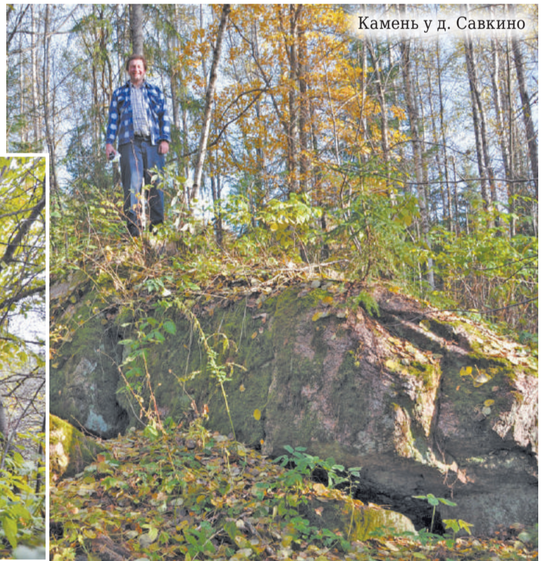
Камень у д. Савкино