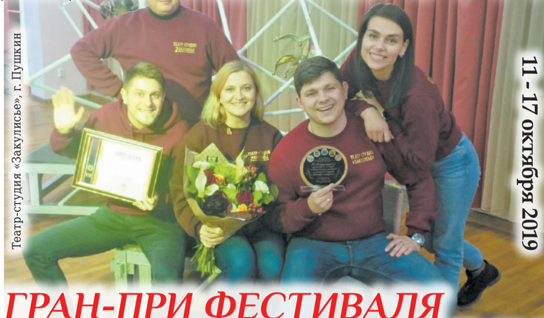
Театр-студия «Закулисье», г. Пушкин