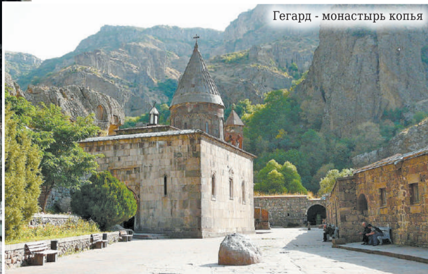
Гегард - монастырь копыя