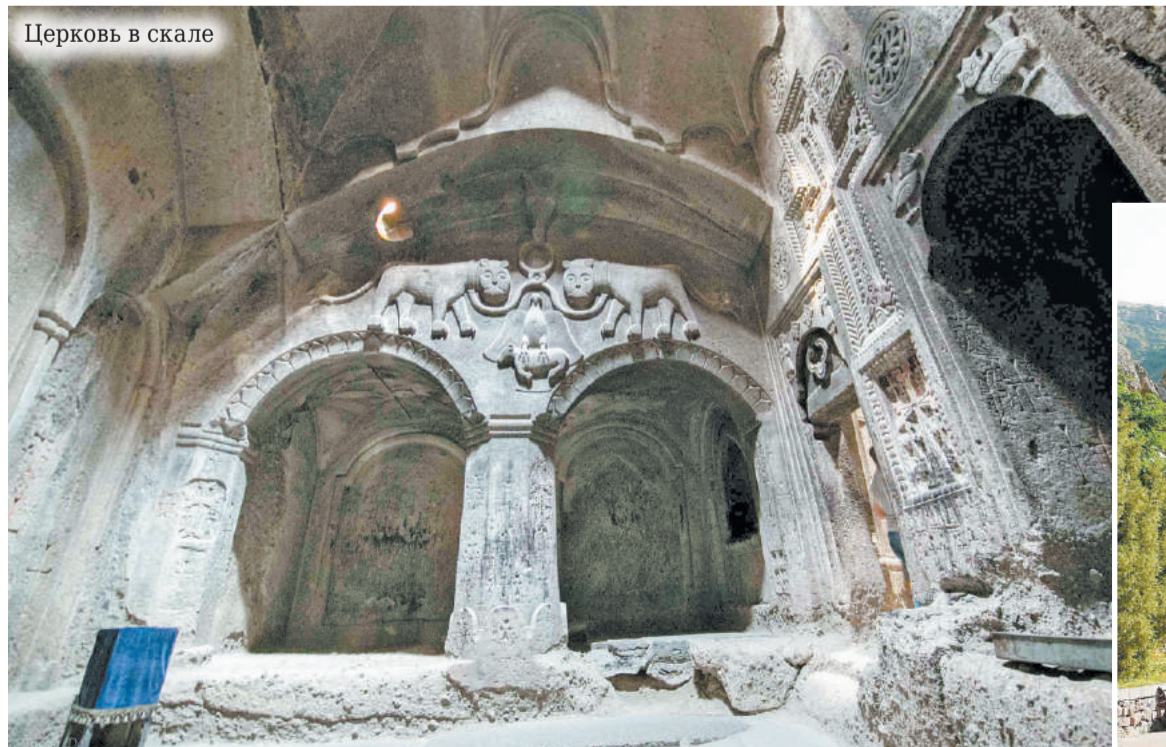
Церковь в скале

Пока огонь в мангале был сильный, на шампуры нанизывали целые овощи: помидоры, перцы, баклажаны и запекали, часто поворачивая с боку на бок. А как только дрова прогорели, пришёл черёд мяса. Лёгкий аромат свежего плавающего жира смешивался с запахом дыма и всех голодных доводил