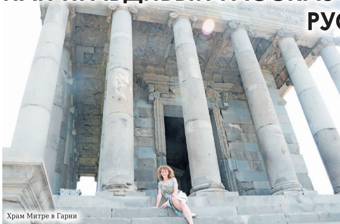
Храм Митре в Гарни

(Окончание. Начало в «УВ» №№ 23-24, 26, 27-28, 29-30, 32, 35, 37/2019)