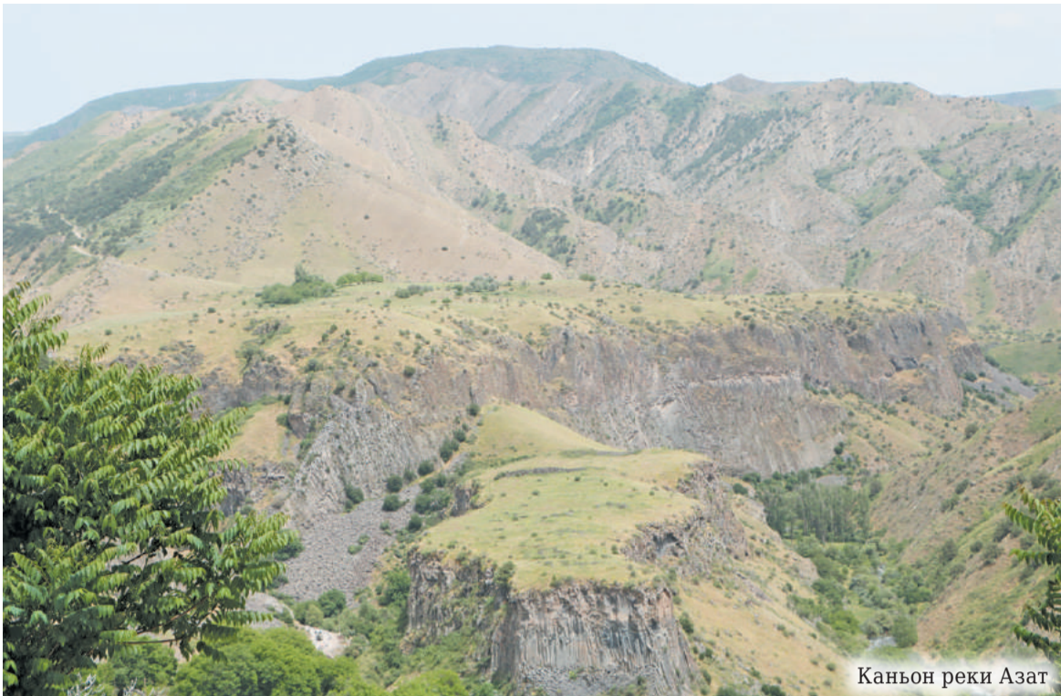
Каньон реки Азат

до головокружения и полуморочного состояния. Благо, что процесс жарки занял всего 15-20 минут.