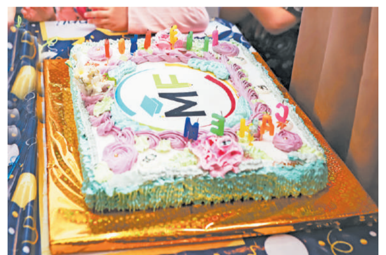
Pizza-party в «MyFamily»