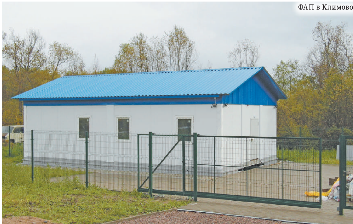
ФАП в Климово