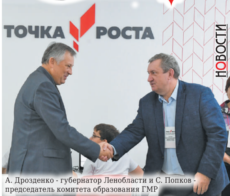
А. Дрозденко - губернатор Ленобласти и С. Попков - председатель комитета образования ГМР