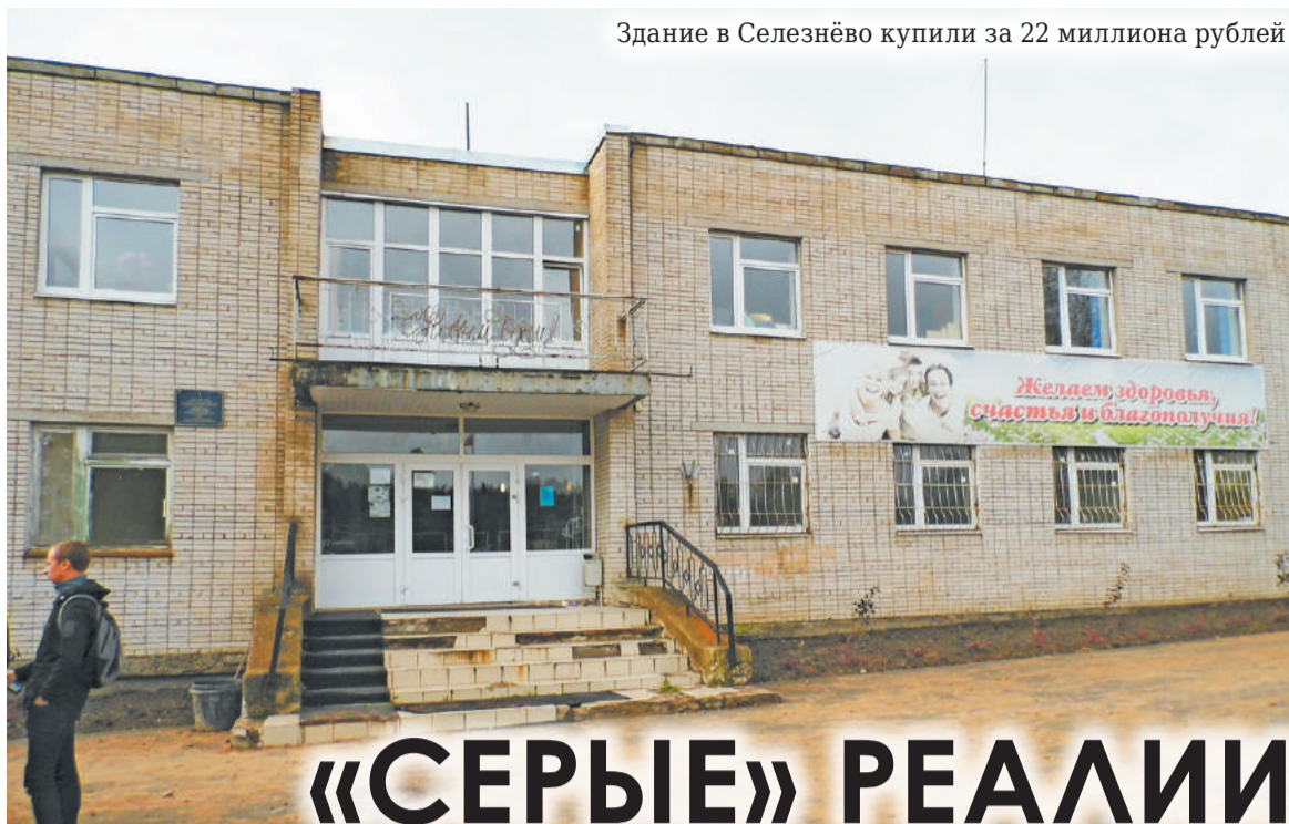
Здание в Селезнёво купили за 22 миллиона рублей