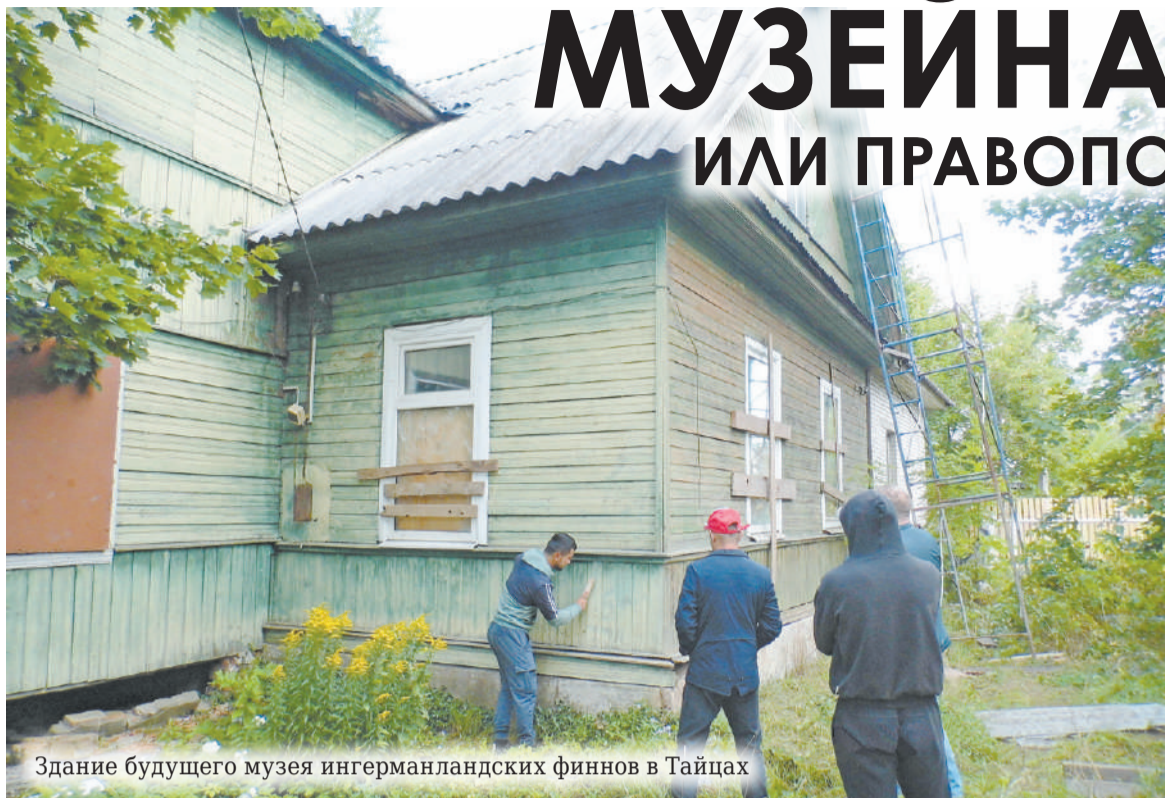
Здание будущего музея ингерманландских финнов в Тайцах