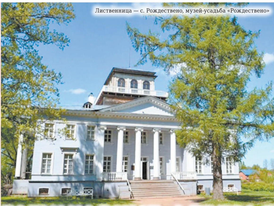
Лиственница — с. Рождествено, музей-усадьба «Рождествено»

Императрица Екатерина II подарила земли Гатчины своему