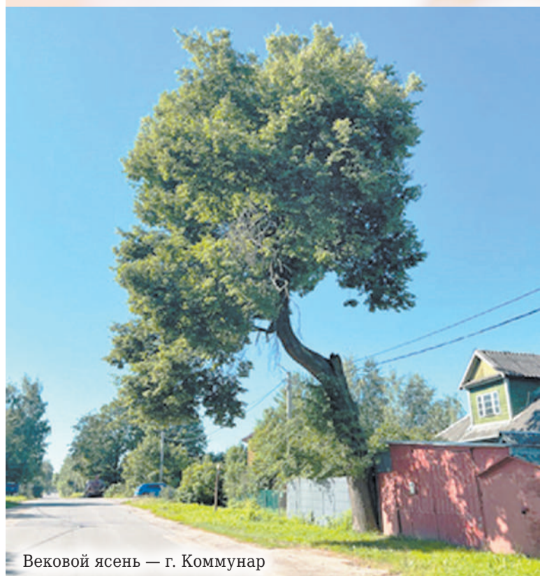
Вековой ясень — г. Коммунар

Позднее для писателя Набокова велосипед стал лирическим образом, шуршащим колёсами по тропинкам памяти. Эта дорога и сейчас популярна среди велосипедистов — с трудом они въезжают по крутому склону, а старинная памятная липа второе столетие встречает и провожает их.