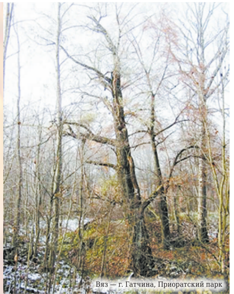
Вяз — г. Гатчина, Приоратский парк

АС-Медиа, по информации комитета по природным ресурсам Ленобласти