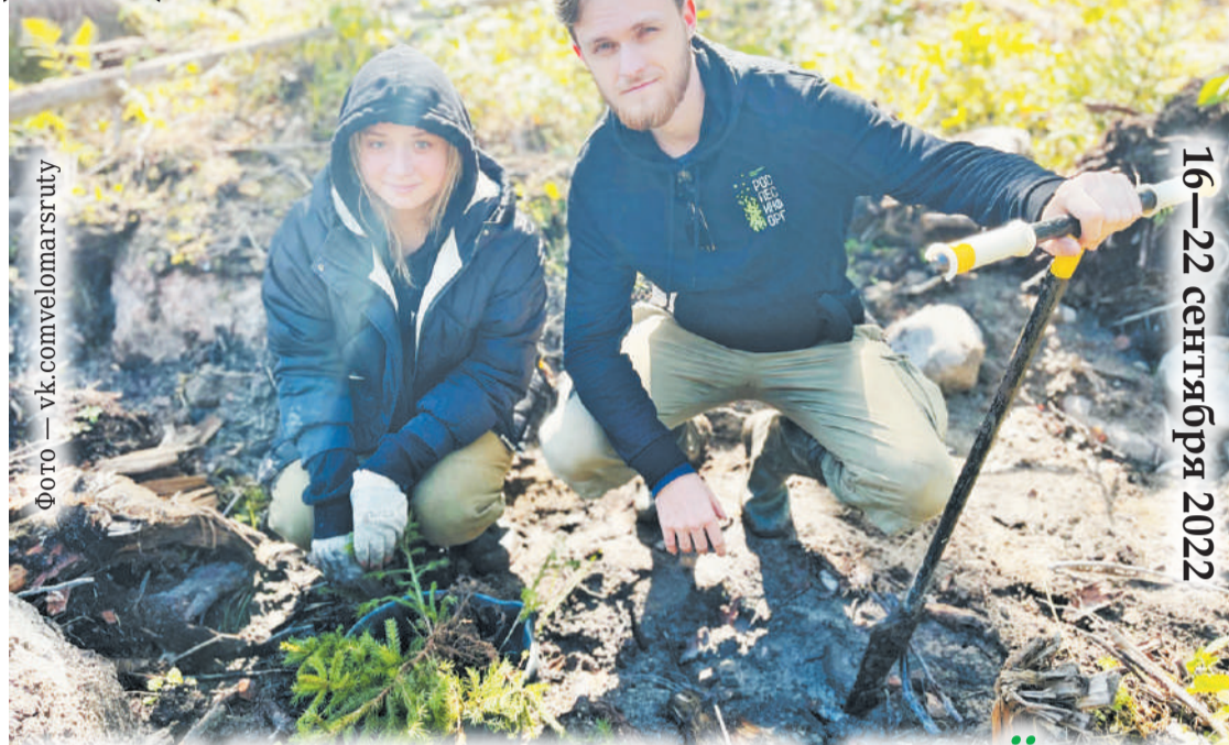
Фото — vk.com/velomarsrutu

Пресс-служба губернатора и правительства Ленинградской области