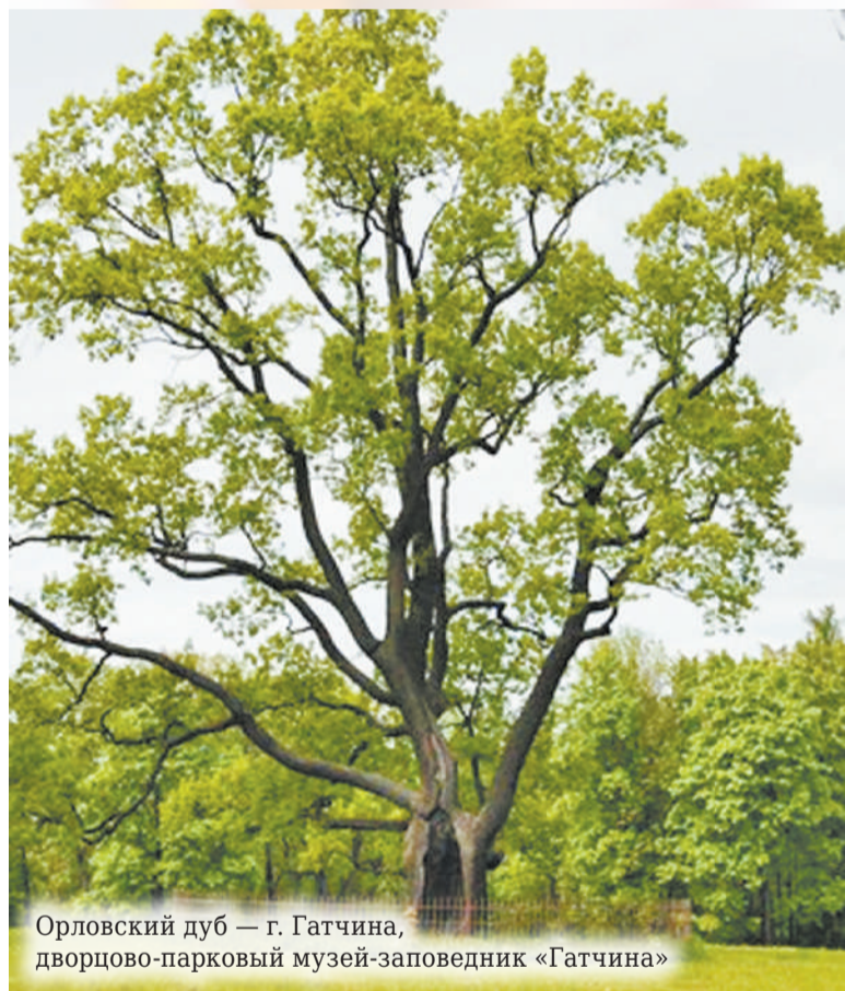
Орловский дуб — г. Гатчина, дворцово-парковый музей-заповедник «Гатчина»

фавориту — графу Григорию Григорьевичу Орлову. Для обустройства резиденции был приглашён лучший архитектор того времени — Антонио Ринальди. По его проекту строился дворец и обустроивался парк. Именно тогда и появился на Серебряном лугу небольшой дубок.