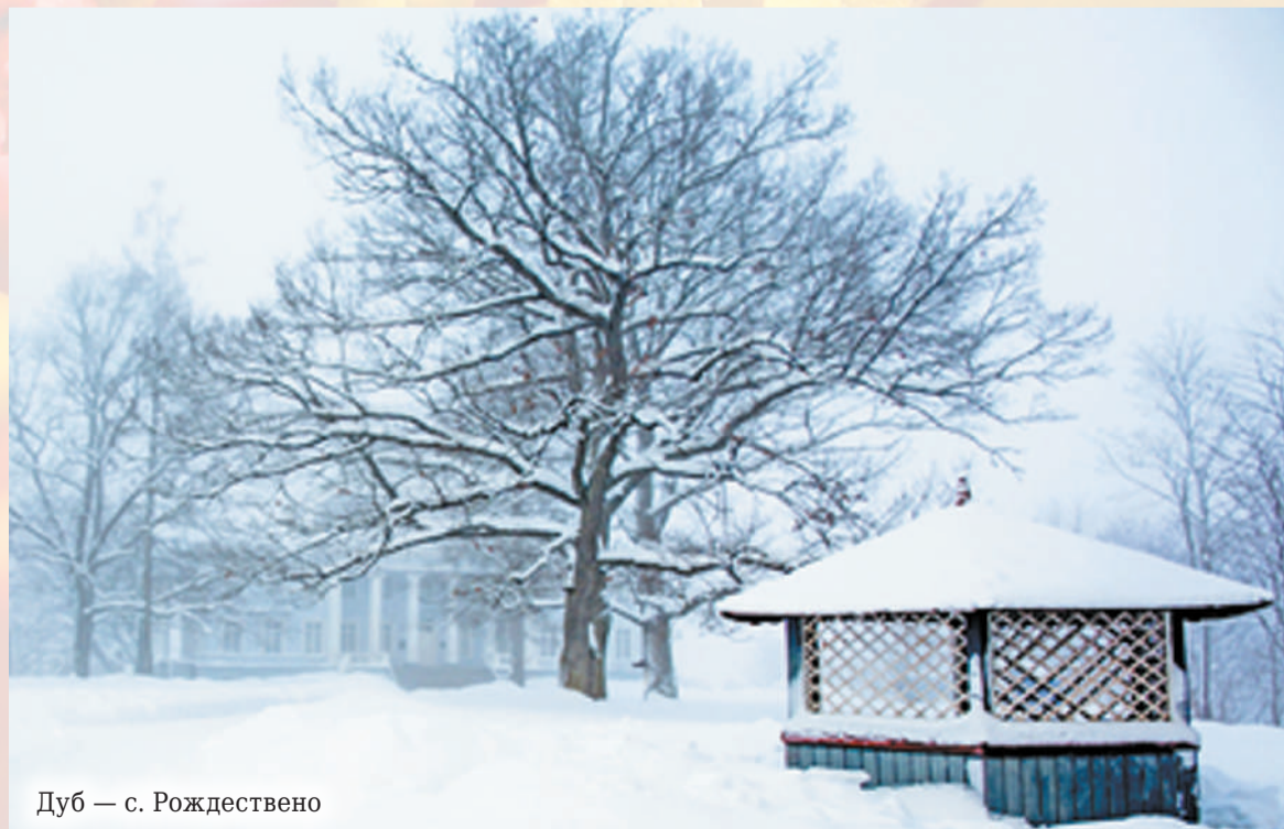
Дуб — с. Рождествено