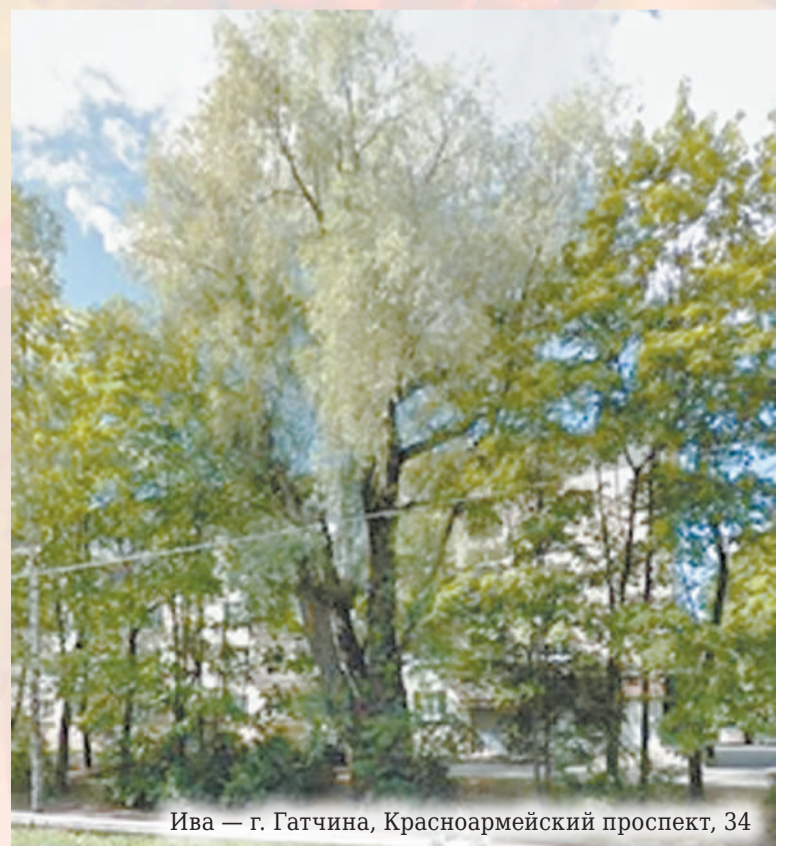
Ива — г. Гатчина, Красноармейский проспект, 34