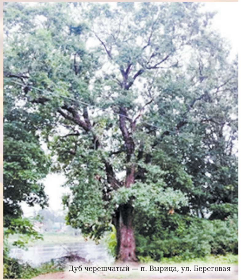
Дуб черешчатый — п. Вырица, ул. Береговая