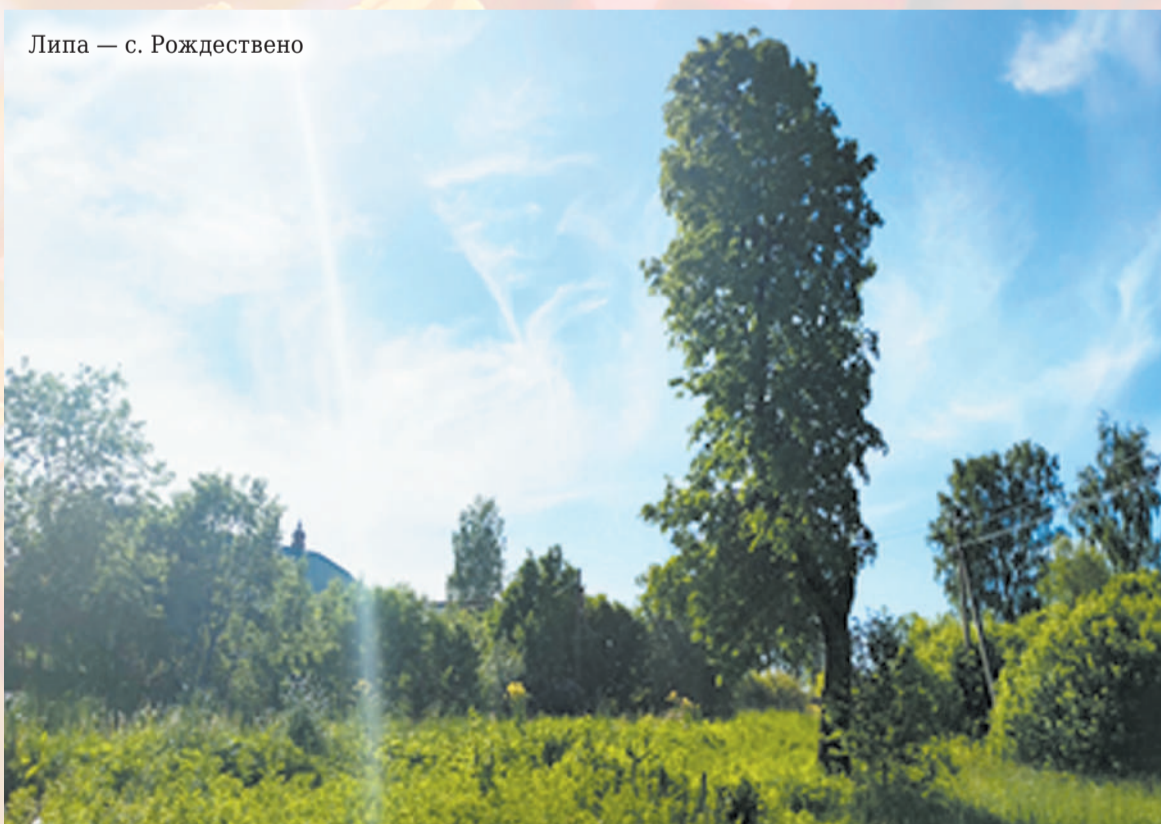
Липа — с. Рождествено