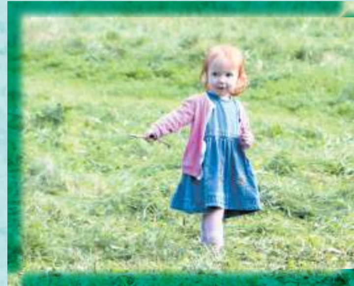
► Будущее Сиверского на Лялином Лугу.