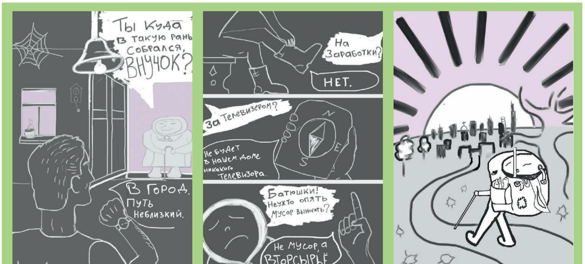
«Раздельный путь», автор идеи и художник: Илья РЫБАКОВ