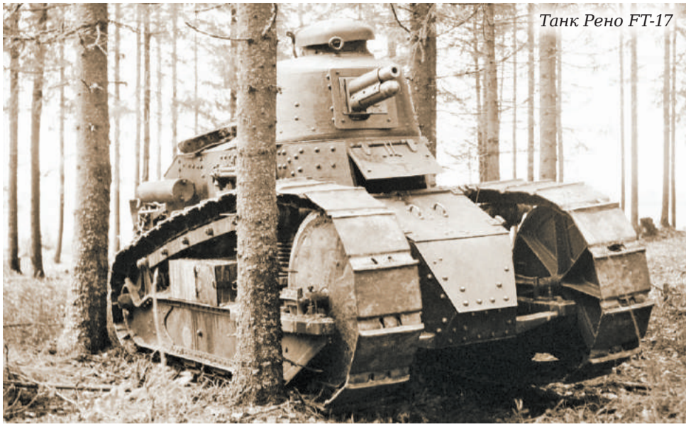
Танк Рено FT-17

колесах, даже став неподвижной, продолжала наносить врагу чувствительные удары.