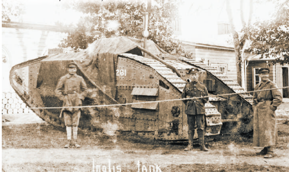
Танк МК-V «Первая помощь» в Гатчине