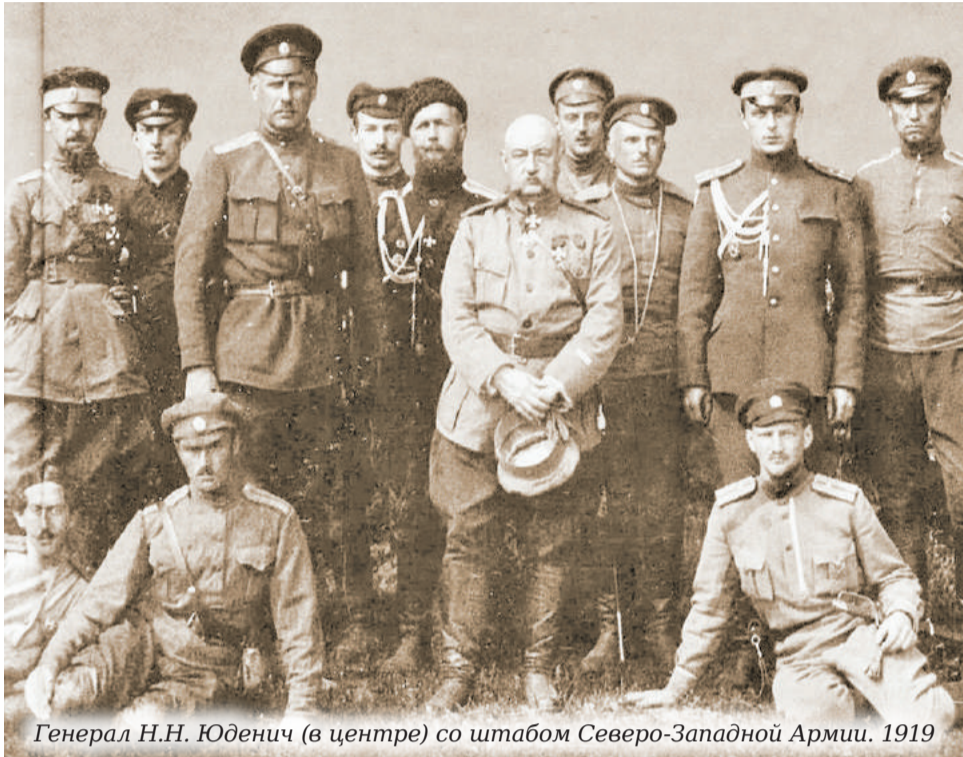
Генерал Н.Н. Юденич (в центре) со штабом Северо-Западной Армии. 1919

В 1919 году Гатчина оказалась в горниле гражданской войны. Самые драматичные и невероятные, полные неясностей и противоречий, события происходили в наших краях в октябре, во время второго похода генерала Н.Н. Юденича на Петроград.