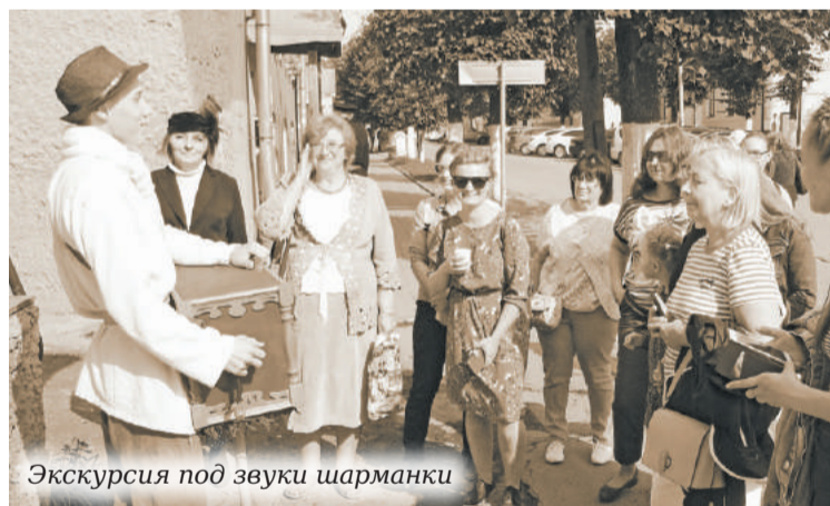
Экскурсия под звуки шарманки

Николай МОНАСТЫРНЫЙ, «Уездные Вести», 2018 год