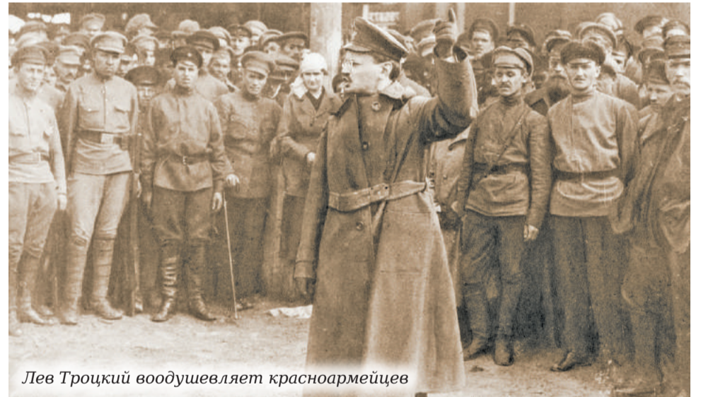
Лев Троцкий воодушевляет красноармейцев

Белогвардейские офицеры с горечью вспоминали: «Высшее командование Северо-Западной армии, к сожалению, не имело достаточного опыта в обращении с танками и бросало их в бой без сопровождения пехотных частей, а иногда и в одиночку, без сопровождения других танков. Из-за недостатка резервов, даже Танковый Ударный Батальон был отделён от батальона танков и послан, как самостоятельная пехотная часть, в Лужском направлении. В результате, отступающие красные, как только одиночные танки продвигались вперёд, зачастую возвращались и занимали позиции в тылу танков. Несмотря на такие тактические недочёты, а также