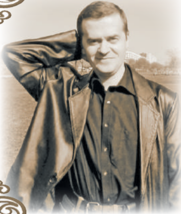
Горицвет АРТИМИР, г. Санкт-Петербург

Говорят, родную землю не найти на картах мира; Африканские пампасы, Гималаи пирамид, - Там, наверное, прекрасно, там, быть может, очень мило, Что б не в туры? - молвят дуры, сделав очень мудрый вид, И останутся озера, полны древнего простора, Нелюдимы и заветны, словно парсуны собора, Амальгамой глядя Небо, что зеркально им горит.