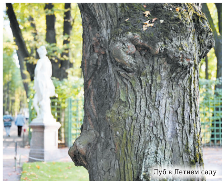
Дуб в Летнем саду

В конце XIX века историческая сосна давно высохла, почти совсем лишилась коры. Высохшую