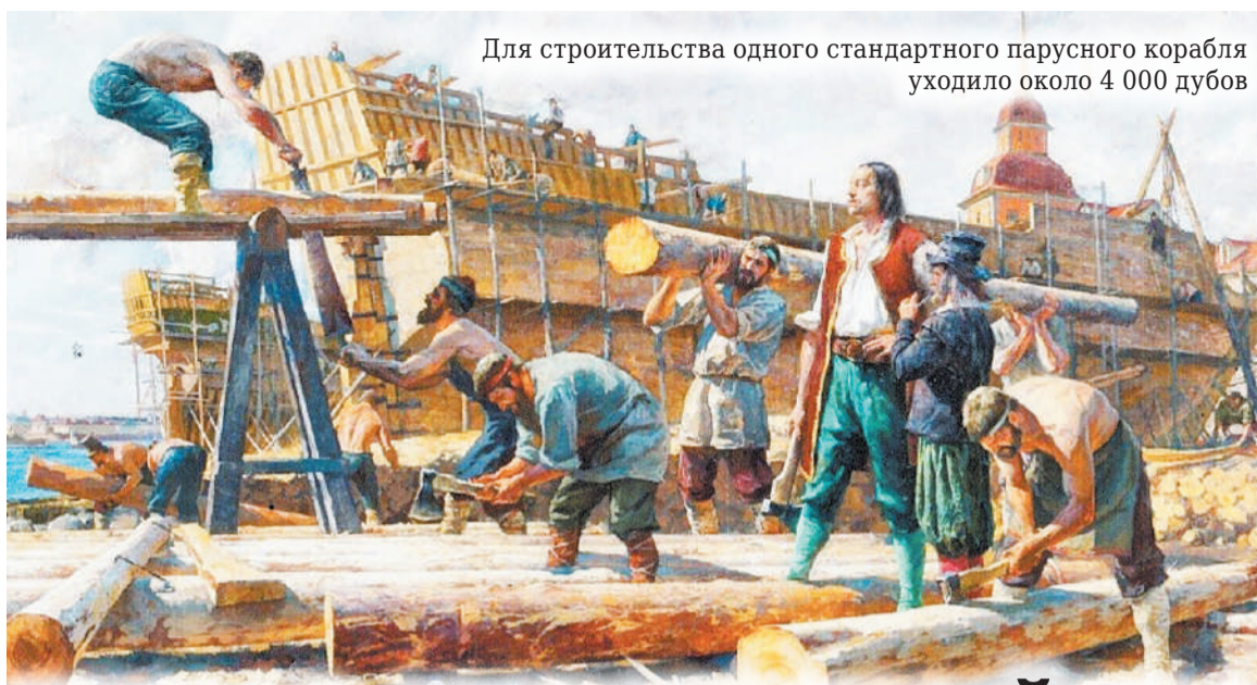
Для строительства одного стандартного парусного корабля уходило около 4 000 дубов

Указ Петра I от 19 ноября 1703 года «Об описи лесов во всех городах и уездах, от больших рек в сторону по 50, а от малых