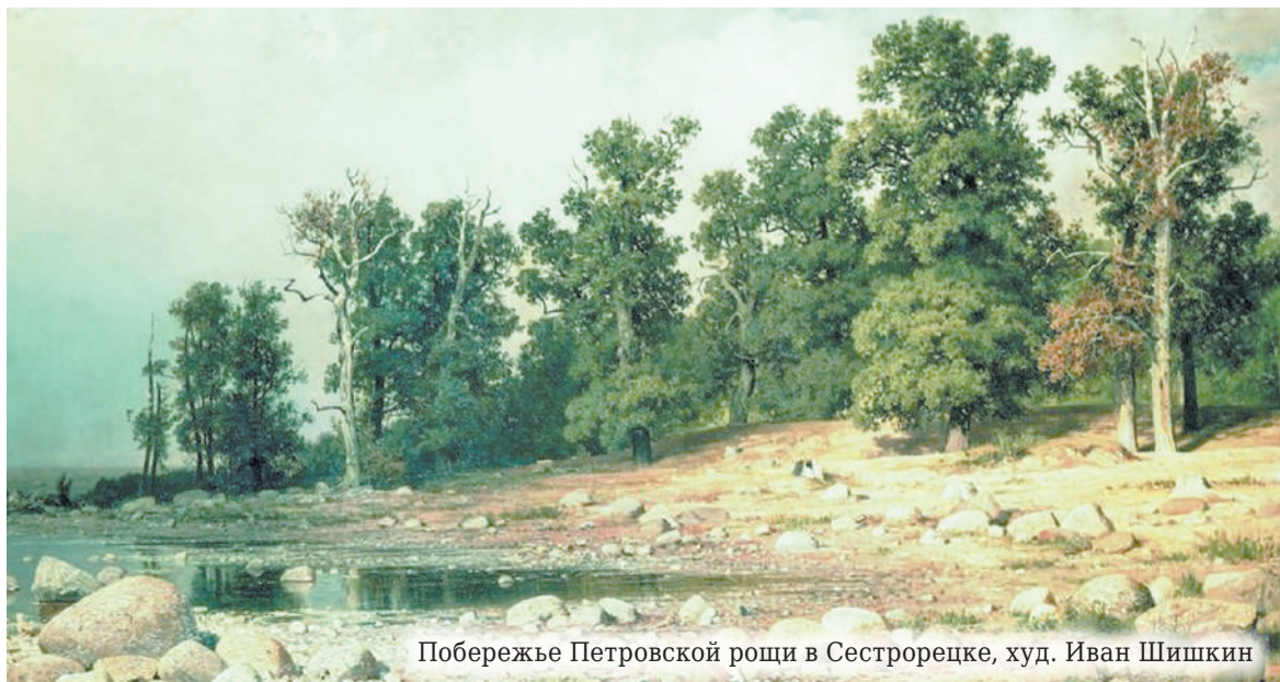
Побережье Петровской рощи в Сестрорецке, худ. Иван Шишкин

Для охраны городских насаждений специальным указом запрещалась «пастьба скота без пастуха, понеже она скотина, ходя по улицам и прочим местам, портит дороги и деревья; а ежели тот скот по-прежнему будет по улицам и в других местах ходить без пастухов, и за то