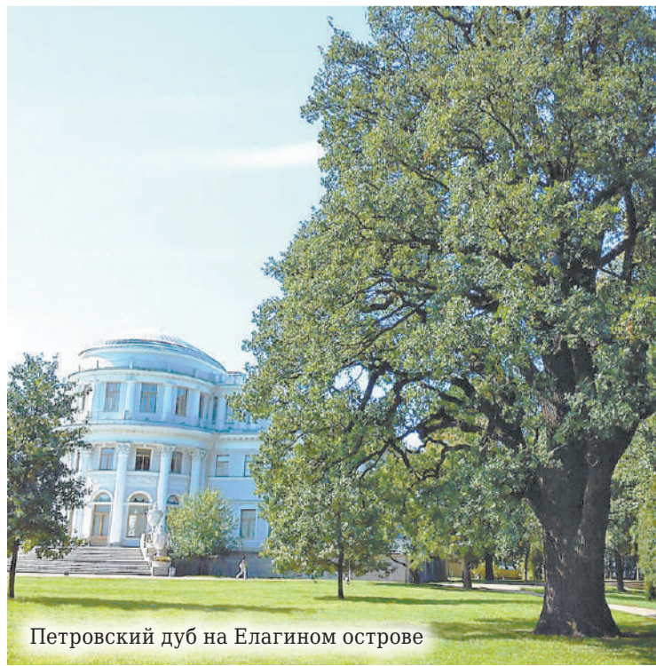
Петровский дуб на Елагином острове