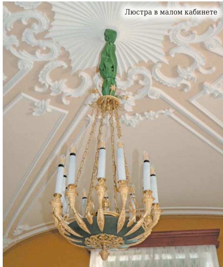
Люстра в малом кабинете

Насколько «приличный вид» удалось создать Роману Кузьмину, современные реставраторы судят по акварелям Эдуарда Гау. Именно его работы служат главным иконографическим материалом для воссоздания комнат Николая I. Художник впервые приехал в Гатчинский дворец в 1862 году. Сначала он изобразил кабинет царствующего императора Александра II и два кабинета отца императора - Николая I: Большой военный кабинет и Малый военный кабинет. Затем работа по зарисовке интерьеров Гатчинского дворца прервалась на 12 лет, пока Гау получил официальный заказ на создание большой серии видов дворца.