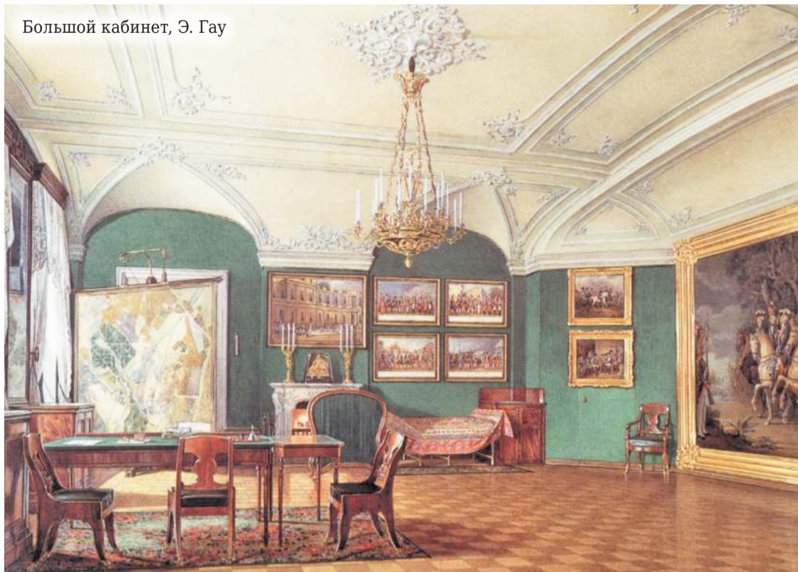
Большой кабинет, Э. Гау

Личные покои Николая I в Гатчинском дворце можно сравнить с историческим центром Петербурга. С одной стороны — помпезность ампира, с другой — игривость декора в стиле неорококо.