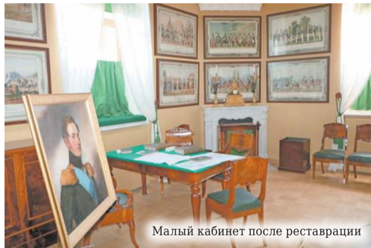
Малый кабинет после реставрации

Вечереющее небо над Гатчиной начало полниться синевой, которую вдруг подсветило заходящее солнце. Вместо того чтобы густеть и темнеть, синева засияла васильковой