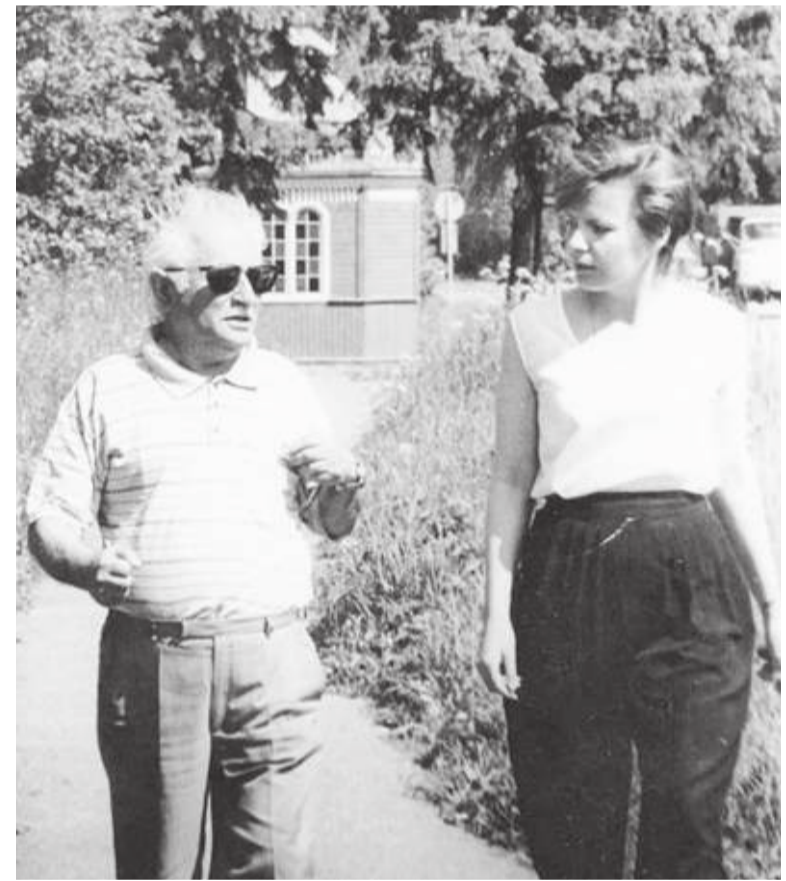
► Исаак Шварц в Сиверском.