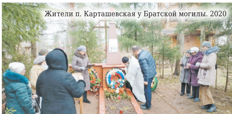
Жители п. Карташевская у Братской могилы. 2020