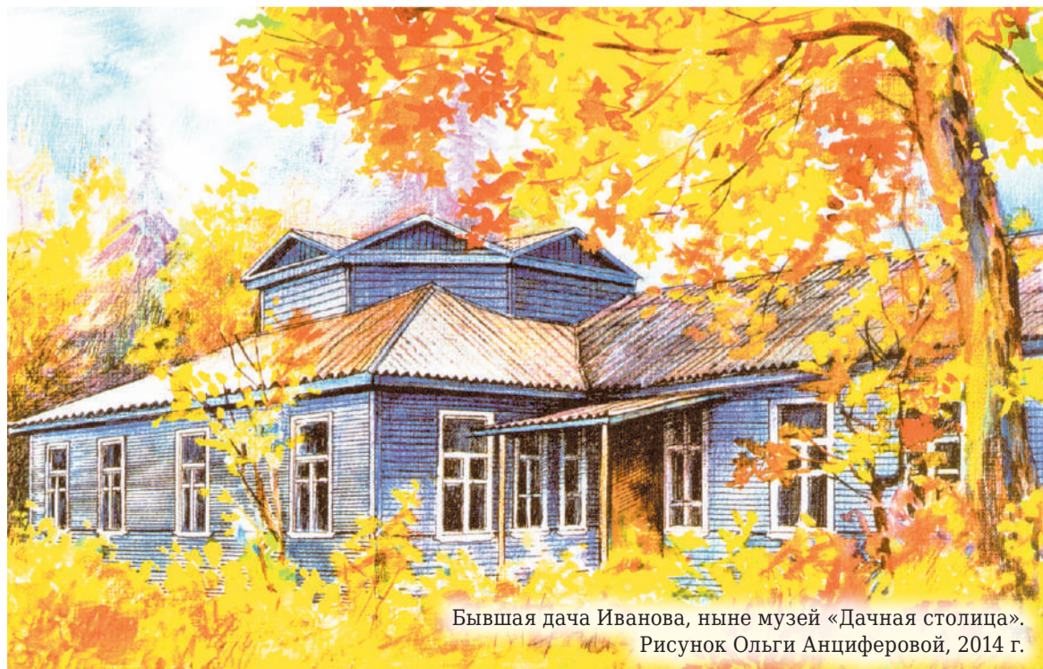
Бывшая дача Иванова, ныне музей «Дачная столица». Рисунок Ольги Анциферовой, 2014 г.

Пресс-служба губернатора и правительства Ленобласти