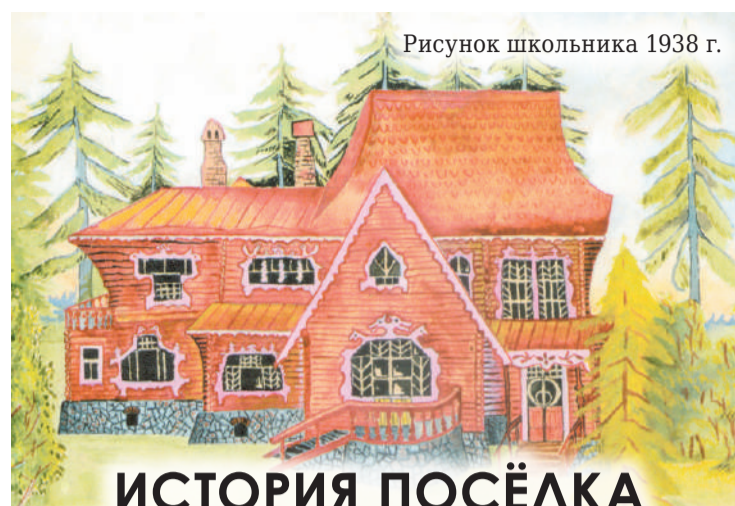
Рисунок школьника 1938 г.

— Без поэзии просто невозможно жить. Жизнь слишком скучна без её красок.