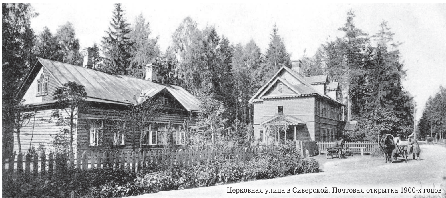
Церковная улица в Сиверской. Почтовая открытка 1900-х годов

Наконец, самой легендарной фигурой дореволюционной и послереволюционной поры среди сиверских дачевладельцев был литератор