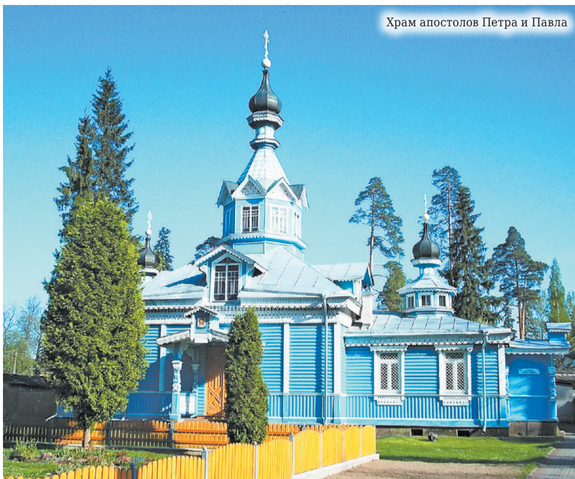
Храм апостолов Петра и Павла