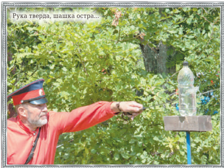
Рука тверда, шашка остра...