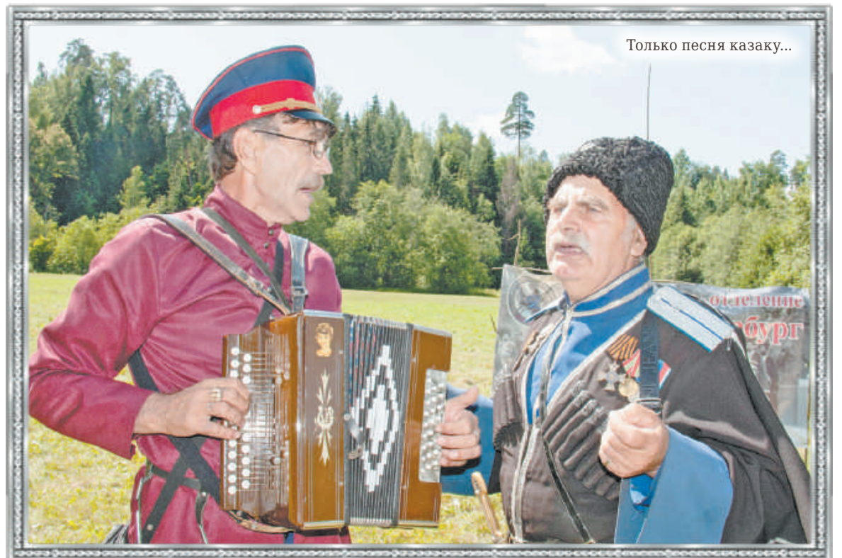
Только песня казаку...

- Казачьи подразделения в русской армии - это вид лёгкой кавалерии. Они были очень мобильны, подвижны, не стеснены обозами. Могли пройти несколько десятков километров по тылам противника и навести там «шороху». (Улыбается.) Вспомним казакатамана Платова, которые своими рейдами