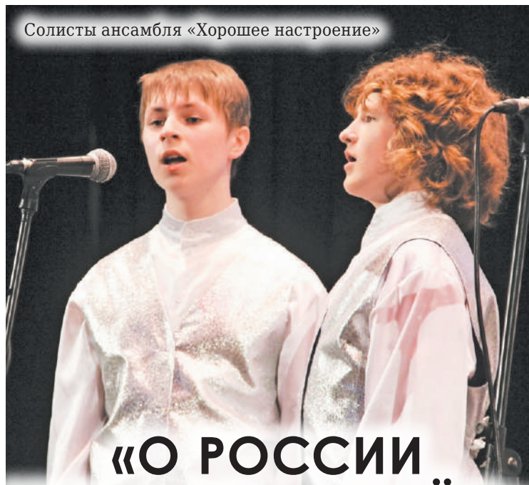
Солисты ансамбля «Хорошее настроение»