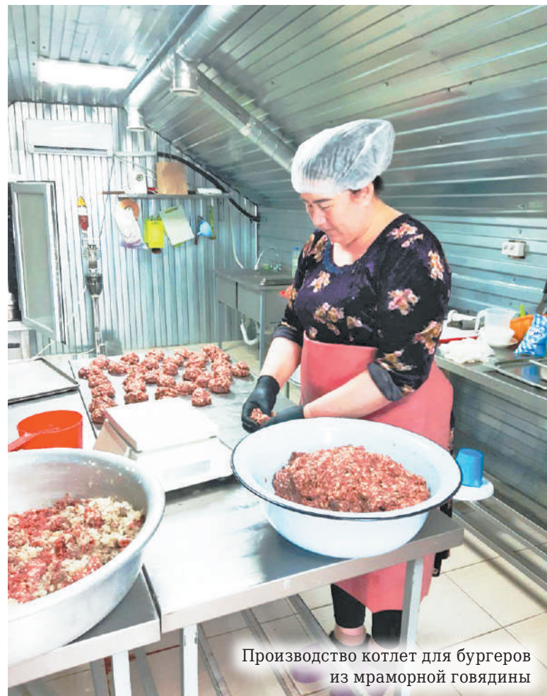
Производство котлет для бургеров из мраморной говядины

— Во-первых, это агротуризм. Мы бы хотели построить ресторан, домик для проживания гостей. Сегодня у нас есть навес, мангал, полевая кухня и большой участок. Кстати, у нас был даже опыт с палатками, которые мы на этом участке размещали. Люди отдыхали в палаточном городке, когда приезжали на экскурсии, потом дегустировали нашу продукцию. И это востребовано уже сейчас. Не-