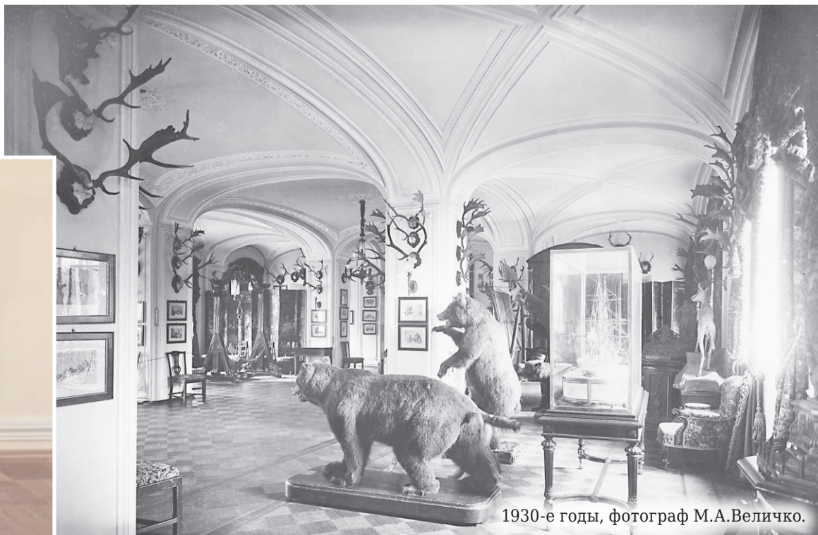
1930-е годы, фотограф М.А.Величко.

Арсенальный зал, сосредоточивший в себе развлечения на любой вкус и возраст, был квинт-эссенцией того, что собой представляла жизнь в Гатчинском дворце. Он не был местом принятия важных политических решений и подписания судьбоносных указов. Он был местом домашнего уюта и отдыха. Свидетельства милых забав и светских развлечений