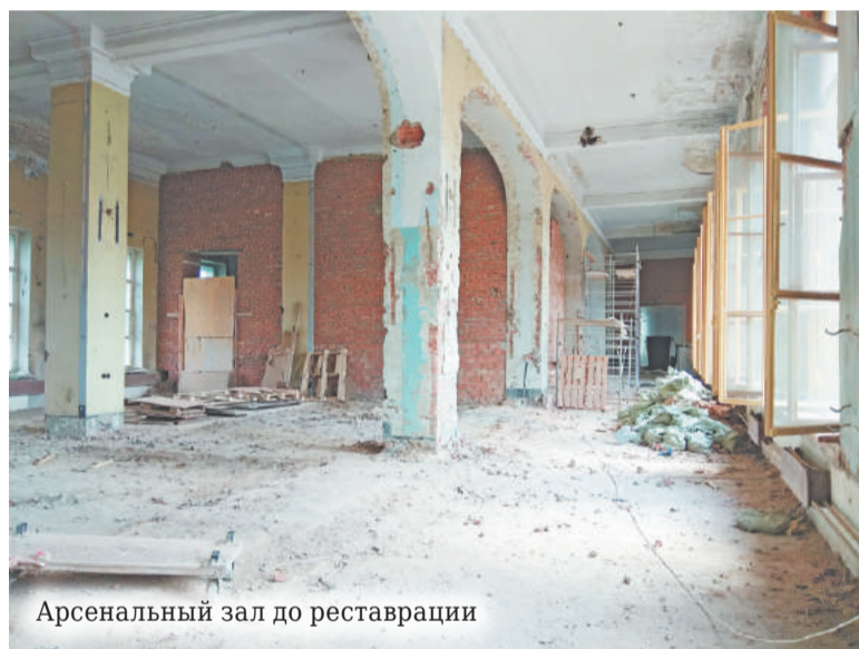
Арсенальный зал до реставрации