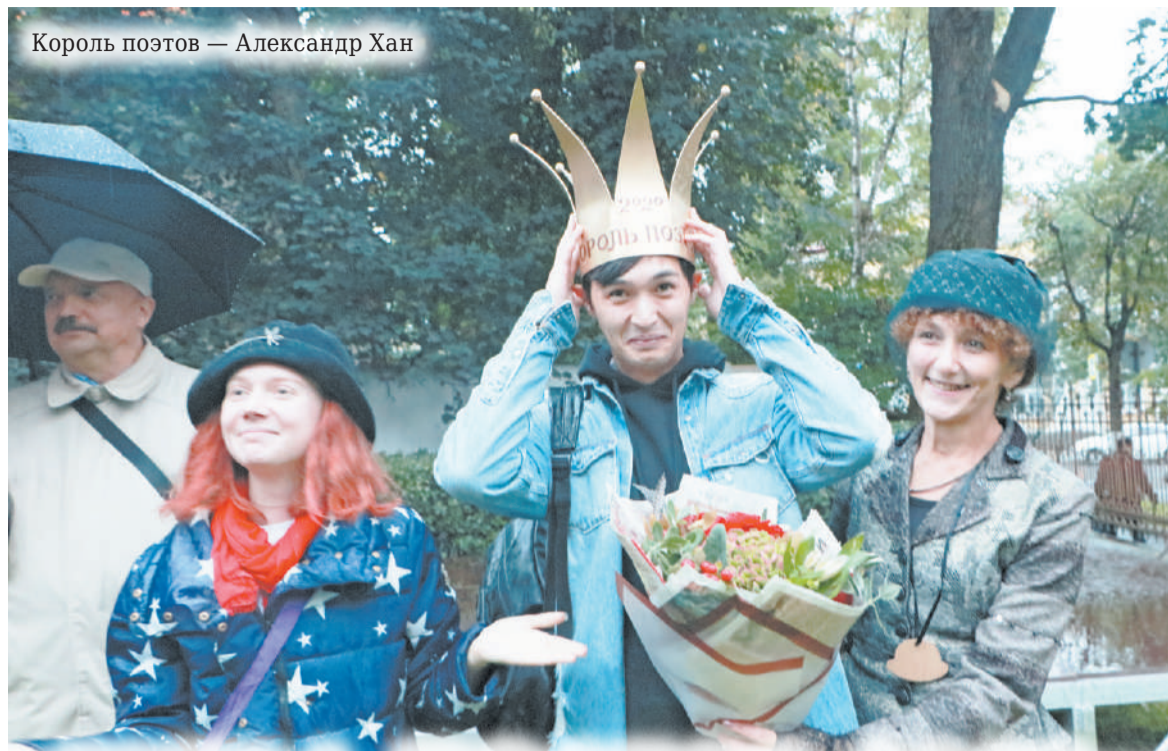
Король поэтов — Александр Хан