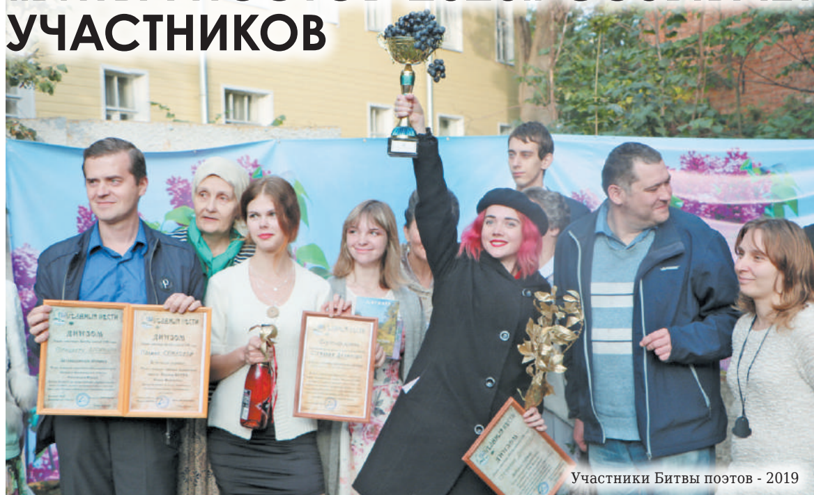
Участники Битвы поэтов - 2019

Идёт приём заявок на поэтический конкурс «Битва поэтов-2020», который состоится в рамках VIII Купринского фестиваля «Чудная штука эта жизнь».