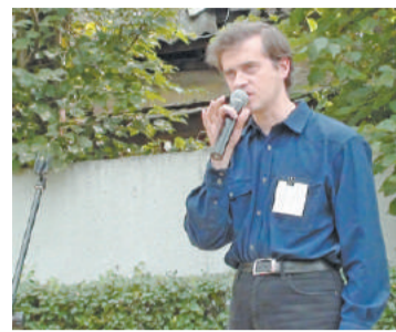
Горицвет АРТИМИР, г. Санкт-Петербург

Когда написали самое первое стихотворение, чем был вызван этот поэтический порыв?