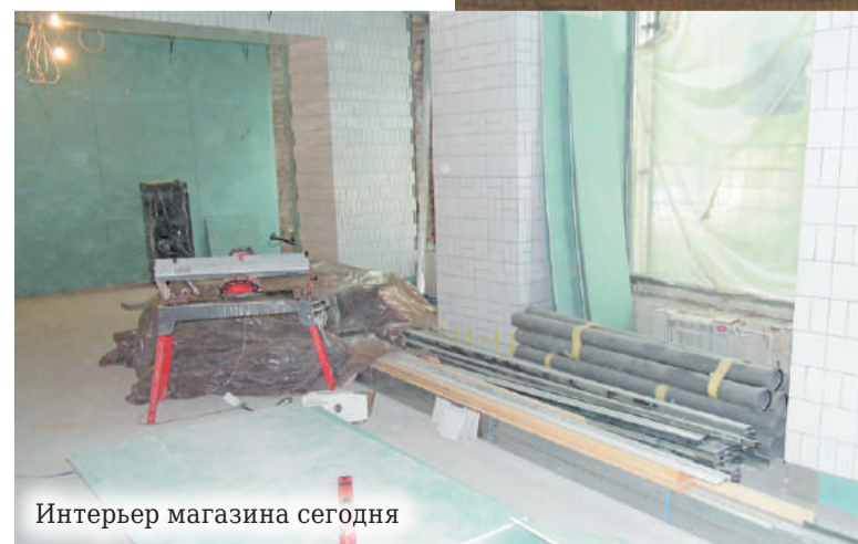
Интерьер магазина сегодня