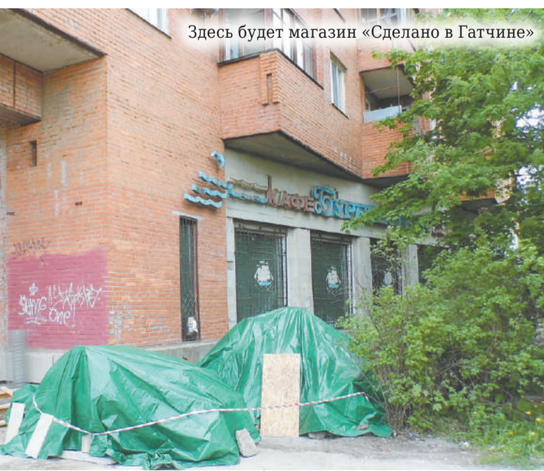
Здесь будет магазин «Сделано в Гатчине»