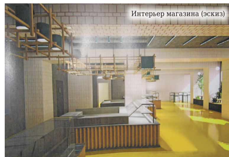
Интерьер магазина (эскиз)