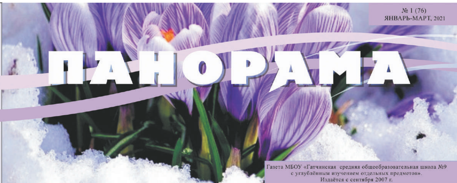
Газета МБОУ «Гатчинская средняя общеобразовательная школа №9 с углублённым изучением отдельных предметов». Издаётся с сентября 2007 г.