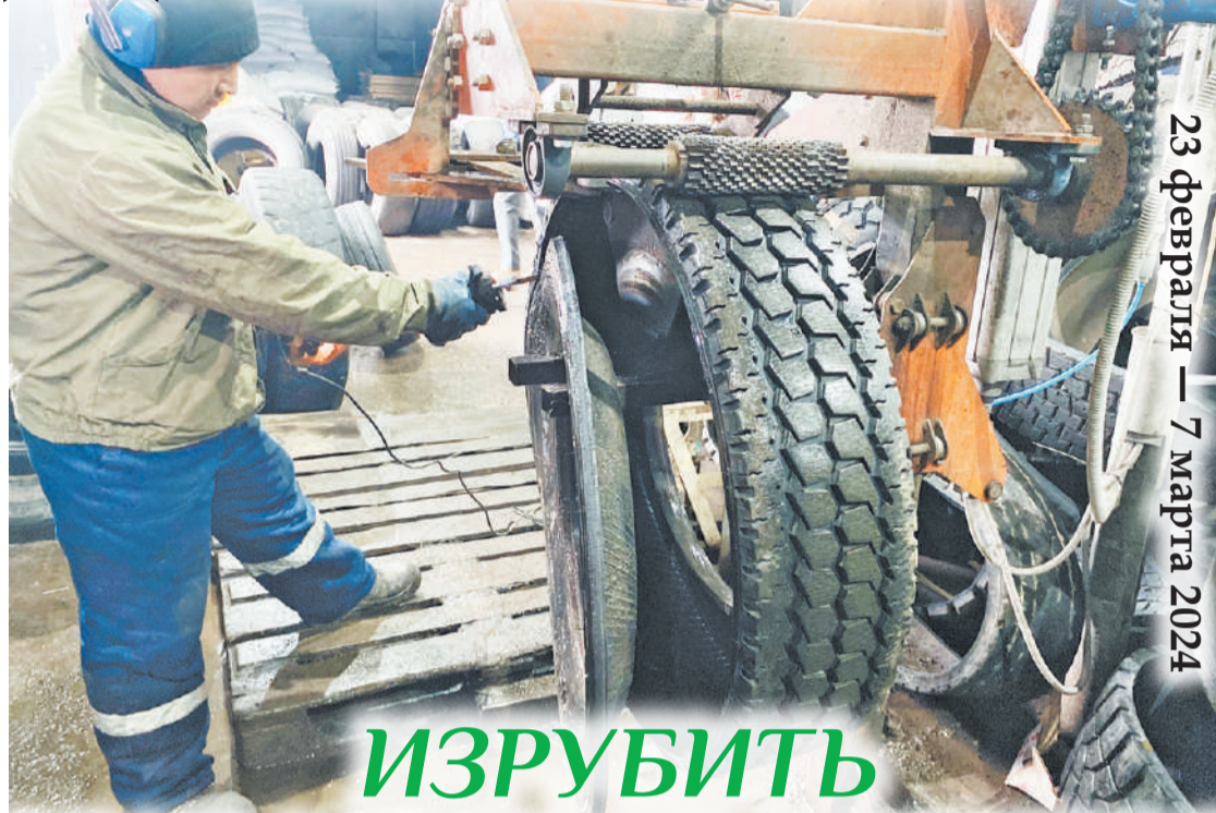
23 февраля — 7 марта 2024

Пресс-служба ГБУК ЛО «Парковое агентство»