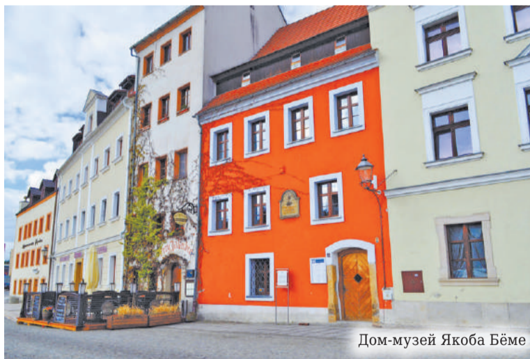
Дом-музей Якоба Бёме

Дело в том, что Якоба однажды посетили видения. В средние века это было модно и происходило нередко. Так, в 25 лет он узрел «сверхъестественное божественное откровение, перенёсшее его в самое сердце мироздания, где его пониманию открылся излучающий всякую жизнь центр, в глубине которого Источник, управляющий невидимыми лучами, связующими всё живое с Создателем». Спустя десять лет Якобу Бёме открылось второе видение, принёсшее ему способность прямого общения со Святым Духом. В 1612 году он впервые отважился открыть своё божественное знание людям, написав «Утреннюю