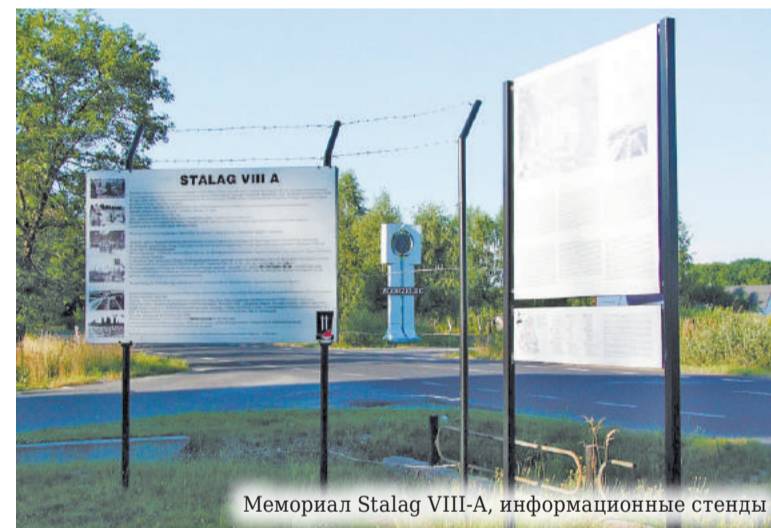
Мемориал Stalag VIII-A, информационные стенды

Не секрет, что в Европе отношение ко Второй мировой войне, скажем так, несколько более толерантно, нежели в России. Там уже давно не делят жертв