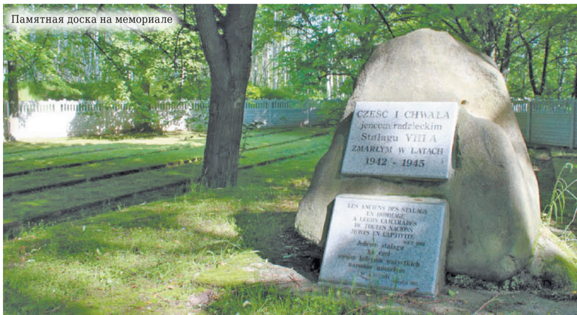
Памятная доска на мемориале

Отношение нацистов к нашим пленным было соответствующим: скудное питание, отсутствие медицинской помощи, издевательства охраны, тяжёлая работа. Зимой - морозы, когда негде было согреться. Тех, кто пытался бежать, был заподозрен в саботаже или