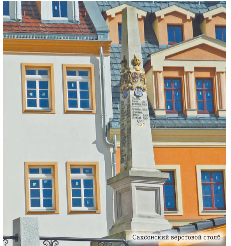
Саксонский верстовой столб

В доме-музее Якоба Бёме старательно восстановлена обстановка, в которой жил и творил философ, представлена домашняя утварь тех времён, аутентично смотрится рабочий кабинет. Конечно, современного туриста, далёкого от теософии, видений и диалектики, вряд ли особенно