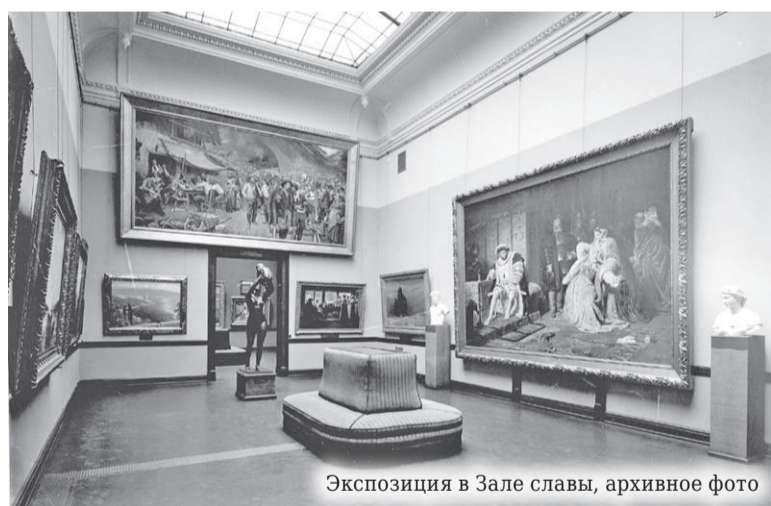
Экспозиция в Зале славы, архивное фото

дня рождения императора Фридриха III. Торжественное открытие состоялось 28 декабря 1902 года в присутствии императора Вильгельма Второго. Год спустя началась организация музея, который открылся 1 июня 1904 года. Музей назвали Kaiser-Friedrich-Museum. Здесь были собраны городские художественные реликвии, старинные книги, образцы вооружения, коллекции монет, древние экспонаты, а также предметы, являющиеся произведением региональных художников.