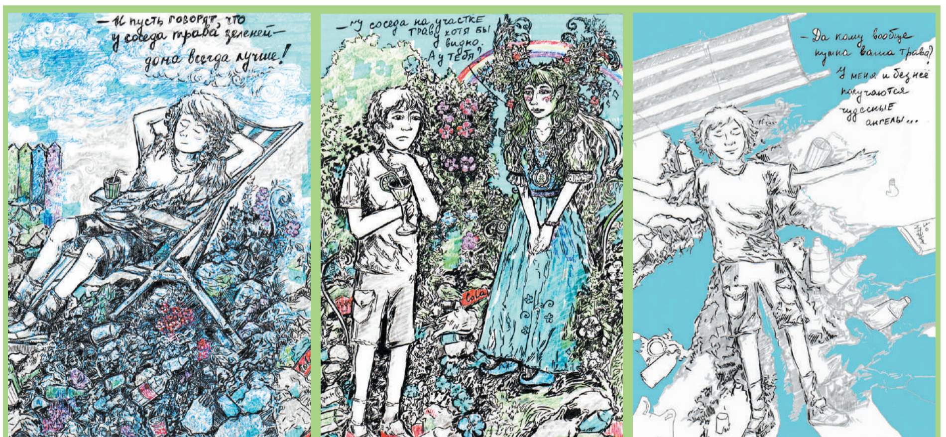
Мусорные «ангелы», автор идеи: Глеб РЫБАКОВ, художник: Зелёный летний дождь.