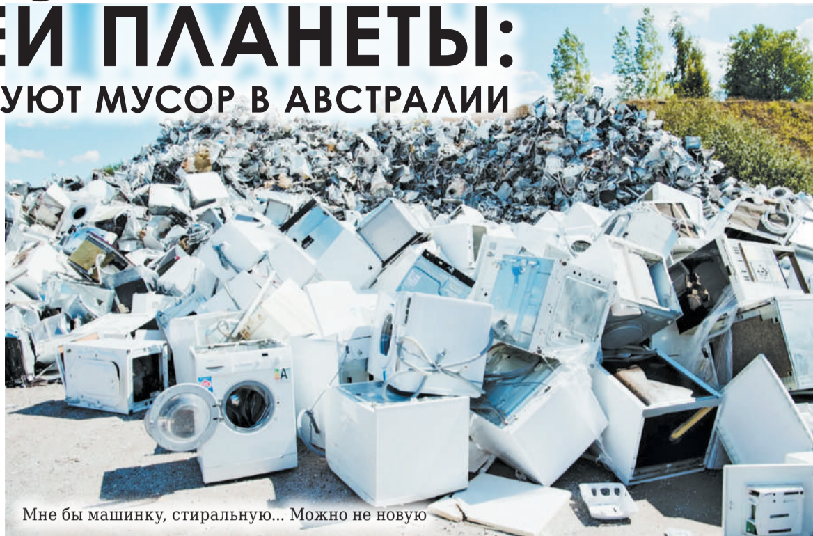
Мне бы машинку, стиральную... Можно не новую

Этим уже занимается не одно поколение, и каждый австралиец знает, какой мусор подлежит переработке. А если вдруг он забудет — ему напомнят рекламные плакаты, расположенные возле мест сбора мусора. Магнитики с пометками о правилах