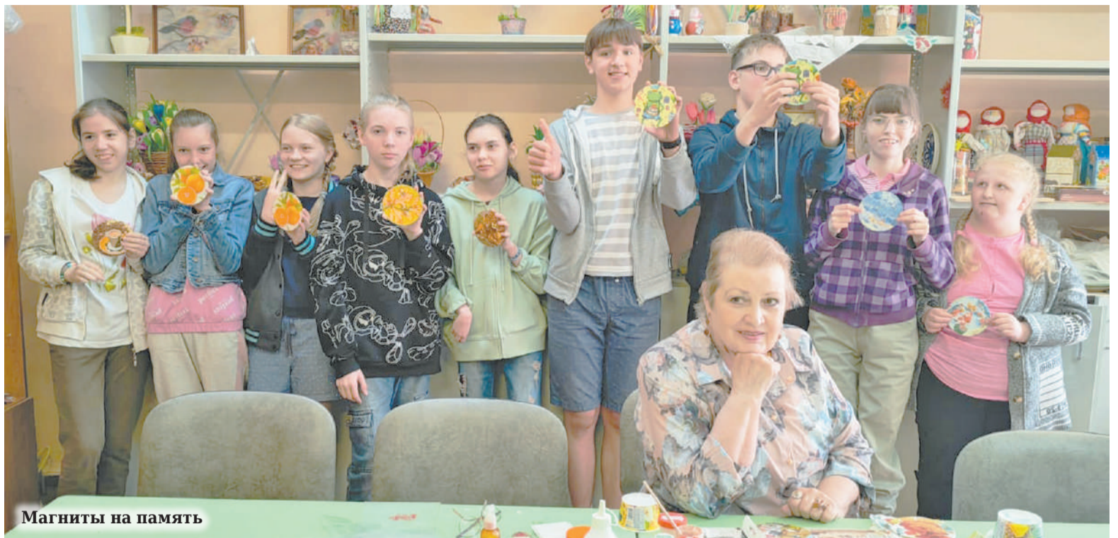
Магниты на память

Например, 6 июня жители «Сиреневого города» символично отправились на экскурсию в город Пушкин. Какой насыщенный, познавательный, интересный и солнечный был день! Первым, что посетили ребята, был музей Первой мировой войны «Ратная палата». Очень интересно было увидеть, какую военную форму носили офицеры, солдаты разных стран