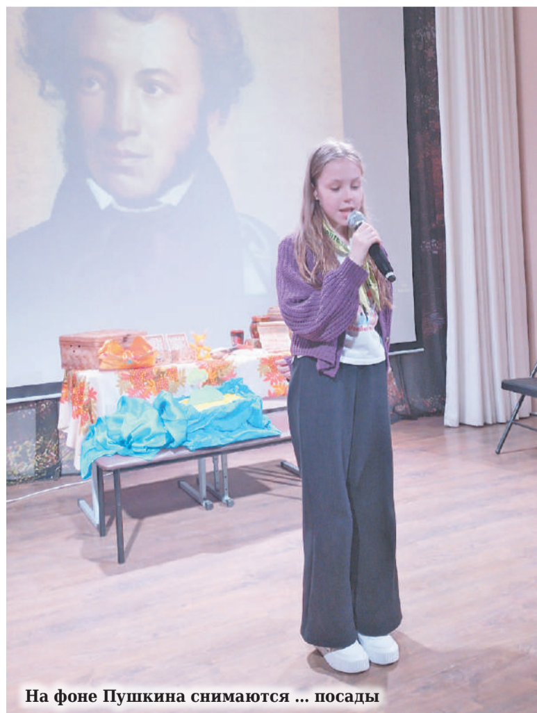
На фоне Пушкина снимаются ... посадки

В первый день лета в Доме творчества «Журавушка» от-