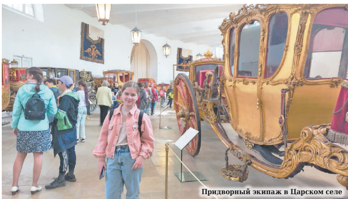
Придворный экипаж в Царском селе