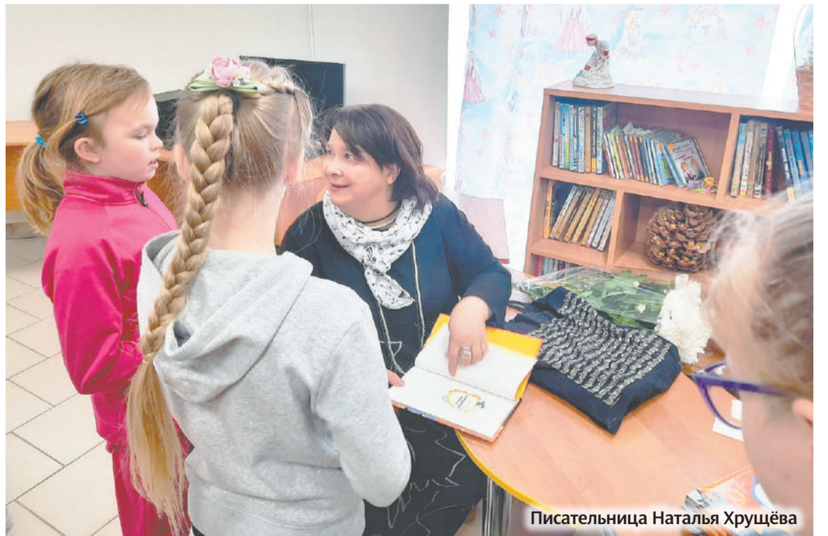
Писательница Наталья Хрущёва