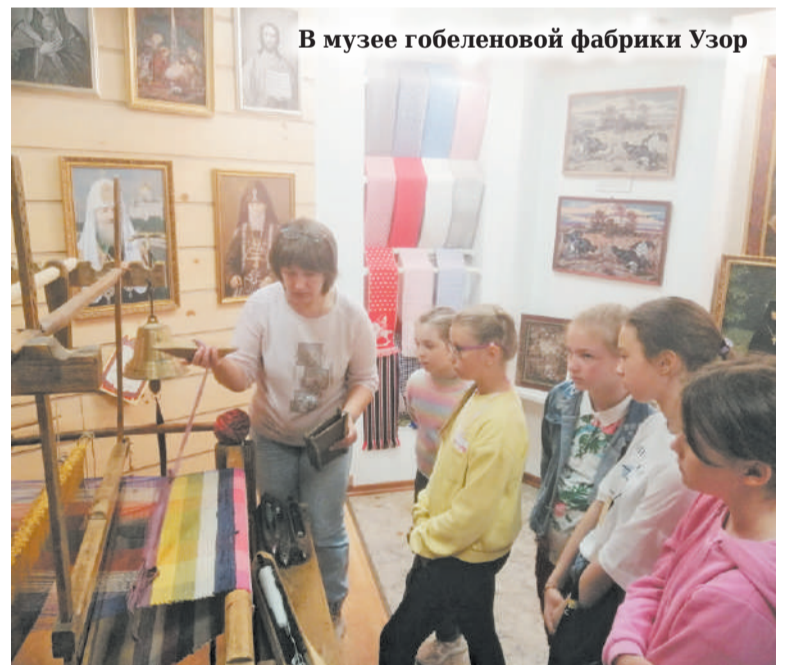
В музее гобеленовой фабрики Узор

В швейном цеху показали процесс раскройки изделий по лекалам на раскроечном