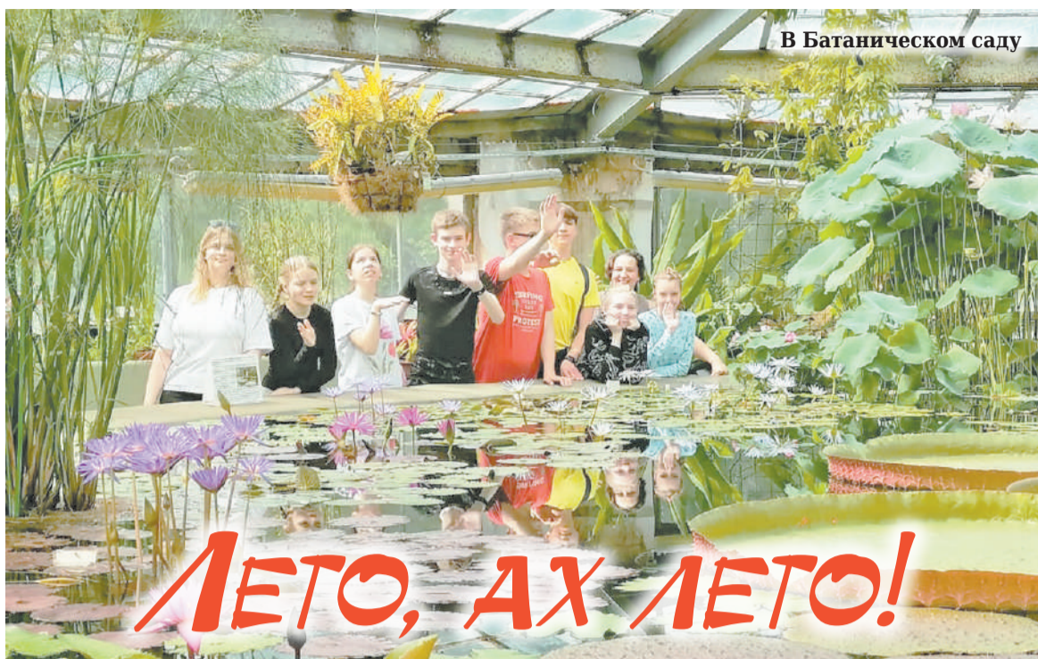
В Ботаническом саду

Мастер-класс проходил в ресторане «Иван-чай» — традиционной русской усадьбе. Особенная старинная атмос-