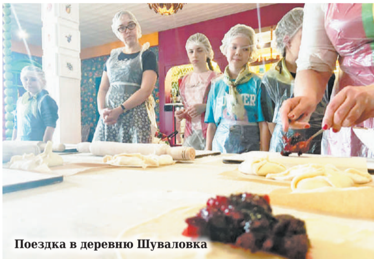
Поездка в деревню Шуваловка

Прекрасный тёплый июнь, насыщенный весёлыми, познавательными, чудесными событиями пролетел на одном дыхании, а запомнится на всю жизнь!