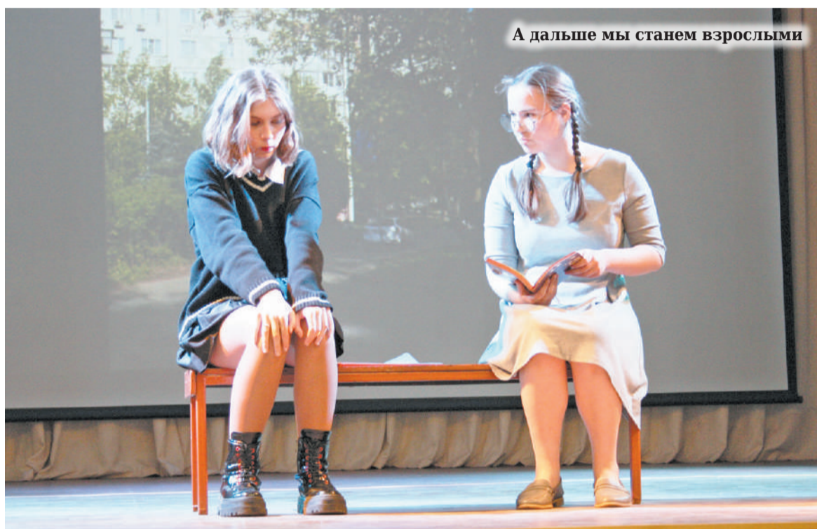
А дальше мы станем взрослыми

А то, что они его любят, сомнений вообще нет. Иначе невозможно было бы собрать такой многолюдный и многоспектаклевый фестиваль, который проходил в мае в Гатчинской школе № 11.