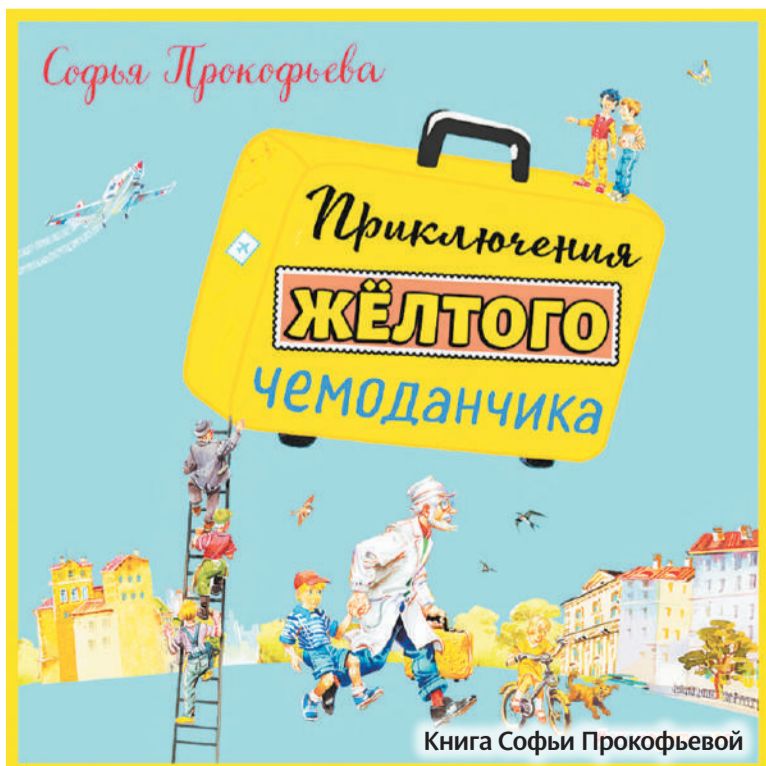
Книга Софьи Прокофьевой

Кто не знает этих строк? Они принадлежат замечательной детской поэтессе Елене Александровне Благининой.