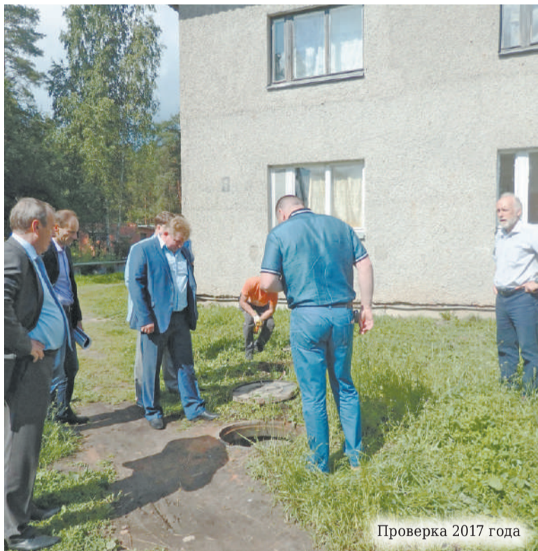
Проверка 2017 года

проектно-сметной документации, не выполнены.