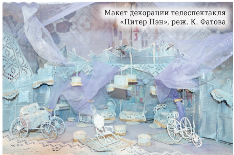
Макет декорации телеспектакля «Питер Пэн», реж. К. Фатова