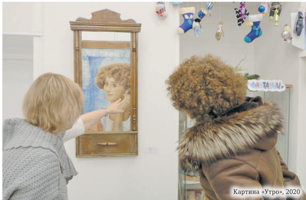
Картина «Утро», 2020