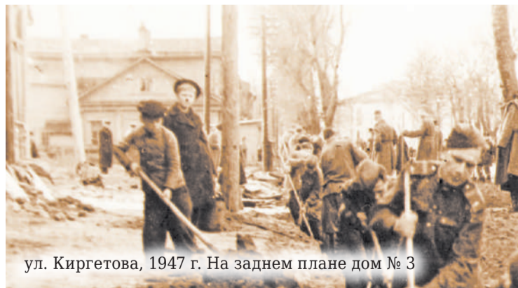
ул. Киргетова, 1947 г. На заднем плане дом № 3