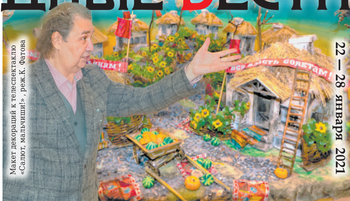
Макет декораций к телеспектаклю «Салют, мальчиши!», реж. К. Фатова